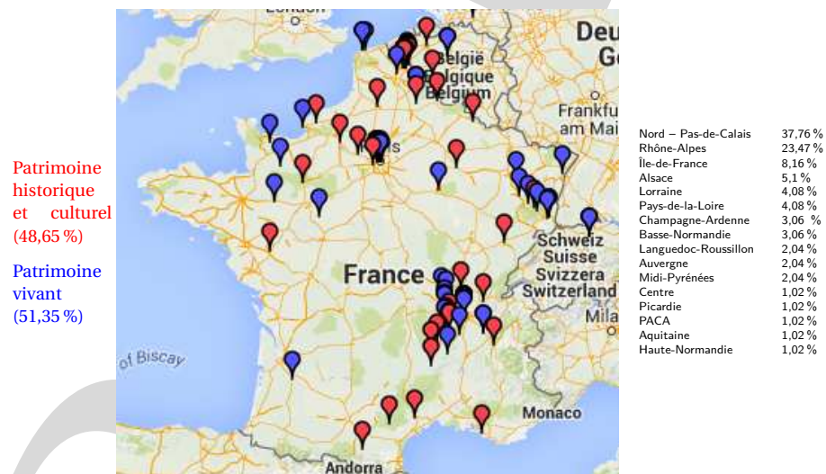
FIGURE 2 – Localisation des acteurs présents sur le territoire français (Métropole).

La Figure 2 met en avant les acteurs présents sur le territoire français. Bien que le point de départ de l'étude soit la région NPDC avec 37,76% des acteurs du réseau, deux autres pôles régionaux ressortent : Rhône-Alpes (23,47%) et l'Alsace-Lorraine (9,18%). Cela s'explique par l'identité industrielle textile forte dans le passé de ces régions. L'Île-de-France ressort également, du fait de la présence de nombreux sièges sociaux d'entreprises et d'institutions. Les territoires du NPDC et de Rhône-Alpes ont un nombre quasiment similaire d'acteurs du patrimoine patrimonialisé que d'acteurs du patrimoine vivant alors que l'Alsace-Lorraine n'est représenté que par des acteurs du patrimoine vivant.