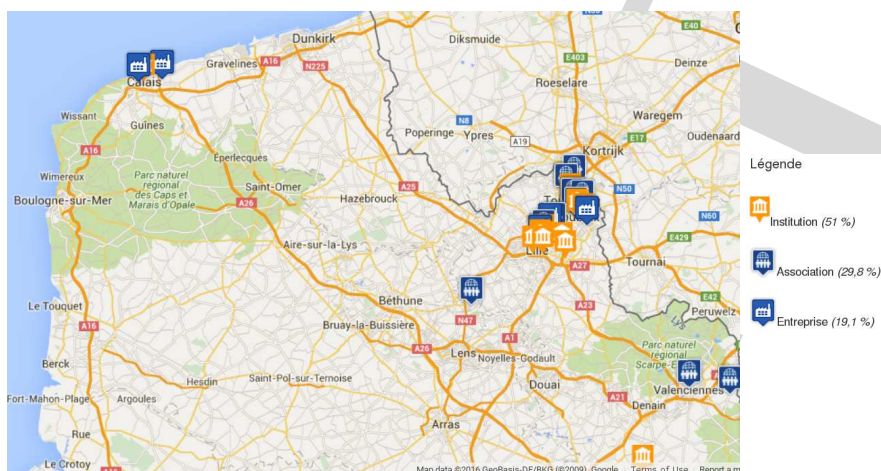
FIGURE 3 – Localisation des acteurs présents dans le Nord – Pas-de-Calais

la Manufacture des Flandres et le musée de la Piscine à Roubaix, la Cité de la dentelle à Calais mais aussi de bibliothèques telles que la bibliothèque numérique de Roubaix, le service commun de documentation de l'université de Lille 3, d'archives comme les Archives Nationales du Monde du Travail à Roubaix, les Archives Départementales du Nord ou encore du laboratoire de recherche IRHIS de Lille 3, d'établissements éducatifs comme l'université de Lille 3, l'École Nationale des Arts et Industries Textiles de Roubaix ou bien de structures municipales ou régionales comme la direction de l'urbanisme de la MEL, la Direction Régionale des Affaires Culturelles ou le service de l'inventaire de la région NPDC, la Chambre de Commerce et d'industrie Nord de France, etc.