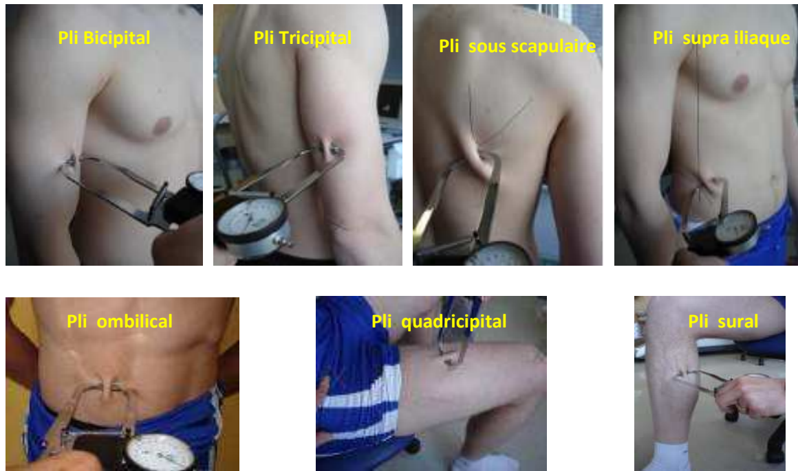
Figure 1. Localisation de mesure des plis cutanés