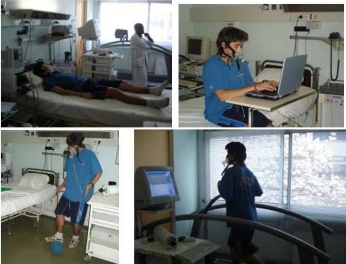
Fig. 1. Exemples d'activités physiques proposées lors d'une étude de calibration.