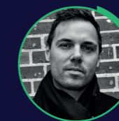
Julien Talpin Chargé de recherche en science politique au CNRS/CERAPS