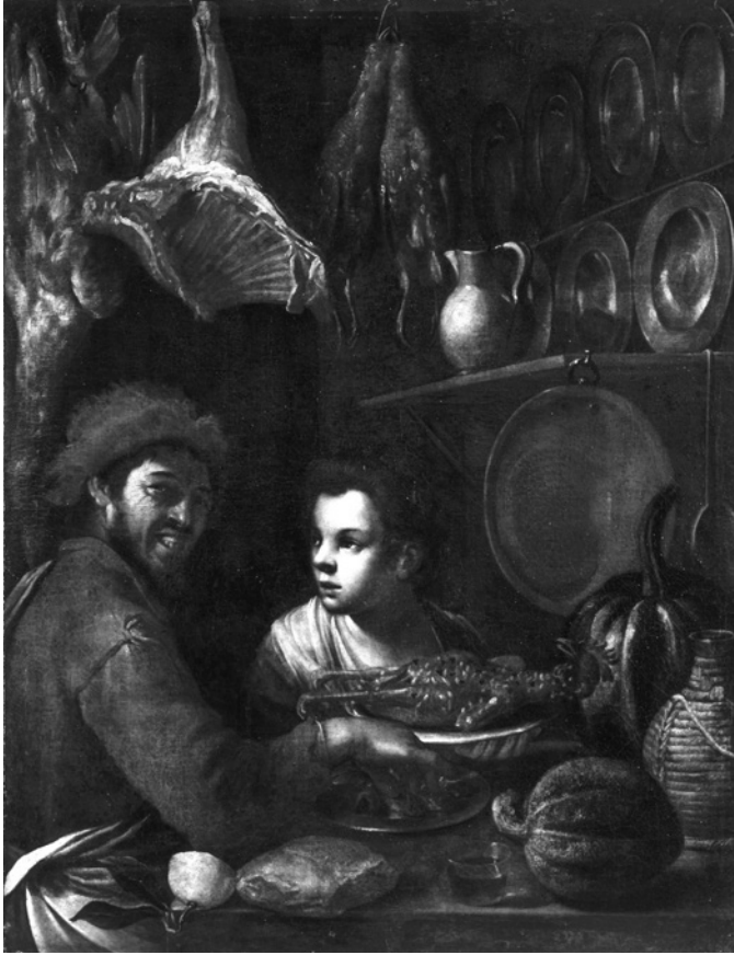
4. Felice Boselli, Cuisinier, servante et provisions , v. 1690, huile sur toile, 125 x 98 cm, Nancy, Musée des Beaux-Arts, Inv. 601

l'espace. Une source lumineuse provenant de gauche illumine le visage féminin et l'œil rieur du cuisinier. L'éclairage est basé sur un fort clair-obscur. La touche précise rend très présents les personnages mais aussi certains objets et le morceau de carcasse animale. Des volailles (canard) et des oiseaux (perdrix grises) sont pendus, des côtes d'agneau semblent couronner le cuisinier. L'intérêt est dans l'effet visuel associant, par la couleur rouge, le carré d'agneau et le chapeau du cuisinier... et non dans la rigueur anatomique du rendu animal. En y regardant de plus près, le morceau de viande dépeint présente une incohérence anatomique : les côtes d'agneaux sont associées à la crosse d'une patte arrière et à un début de collier animal. Le morceau de carcasse volumétrique semble être là pour couronner le cuisinier.