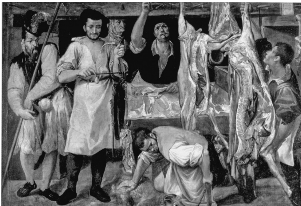
3. Annibale Carracci, La Grande Boucherie, 1582-1583, huile sur toile, 185 x 266 cm, Oxford, Christ Church Picture Gallery