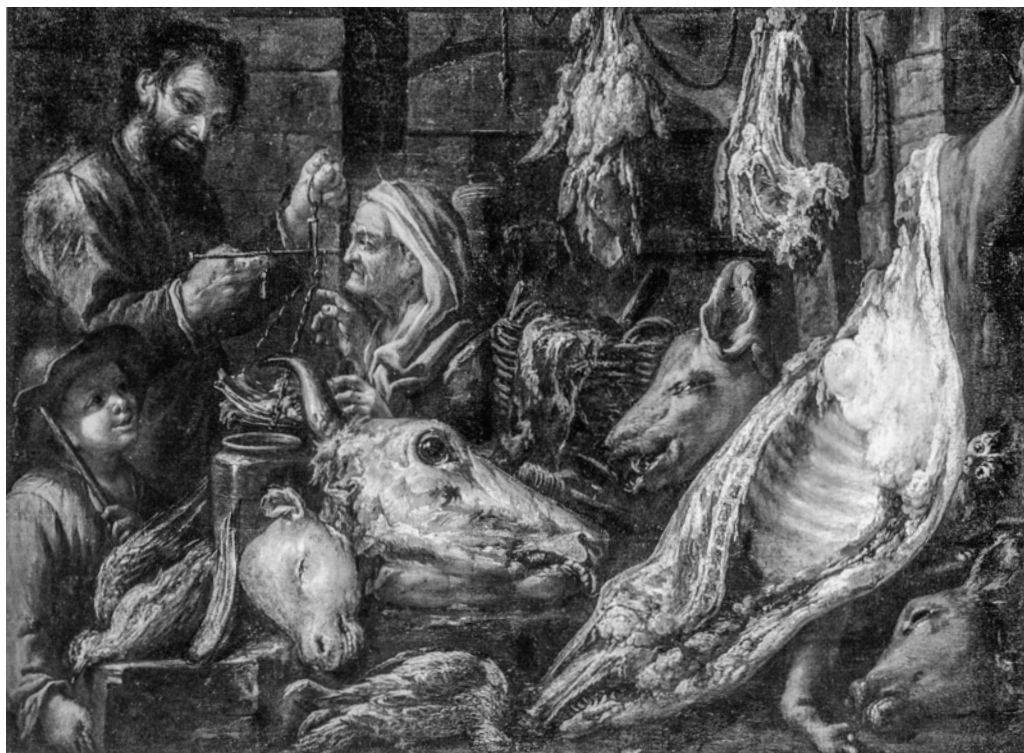
1. Felice Boselli, Boucherie : intérieur de boutique , v. 1720, huile sur toile, 133 x 174 cm, Faenza, Pinacoteca

La Boucherie (fig. 1) de Boselli s'inscrit aussi dans une tradition artistique italienne. Le motif du boucher à la balance est très courant depuis le seizième siècle. Il illustre le thème de la suspicion de tromperie, envers le boucher, sur le poids de la viande. Dans les villes de la région d'Emilie-Romagne, l'importance des bouchers dans la vie politique et économique est certaine. Cependant leur statut reste très ambigu car s'ils sont puissants et riches, la suspicion à leur égard est fréquente. Ils sont, à l'instar des bourreaux, des barbiers et des chirurgiens, toujours frappés du « tabou du sang » 8 et ont la réputation de voler sur la marchandise, soit les autorités publiques, soit les consommateurs. Dans le discours XVI qu'il consacre aux bouchers au sein de sa Piazza universale di tutte le professioni del mondo , Tomaso Garzoni rapporte l'idée semble-t-il très partagée selon laquelle les bouchers sont ceux :