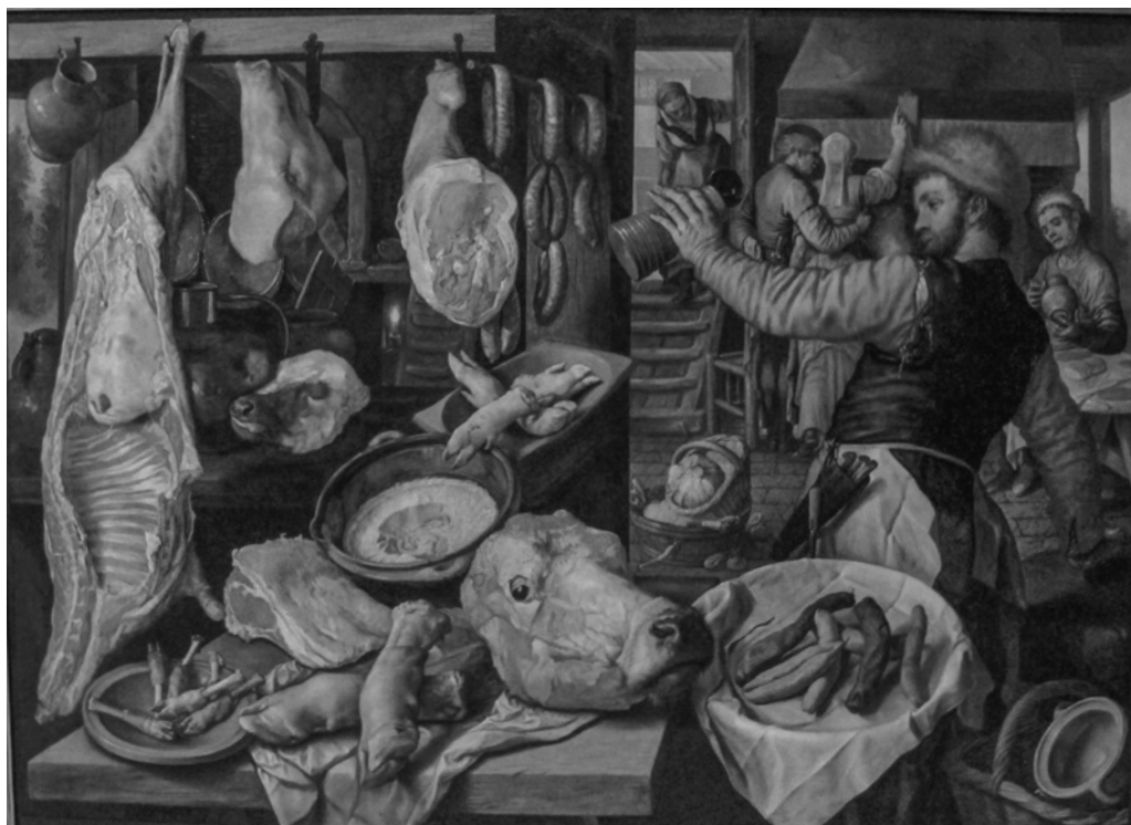
2. Joachim Beuckelaer, Boucherie , 1568, huile sur toile, 146,5 x 204,5 cm, Napoli, Museo di Capodimonte

Les promesses des bouchers sont, comme les vessies de leurs animaux, pleines de vent. Lors de la pesée de la viande aussi, avec la balance, ils la heurtent volontiers avec le doigt, et ils font semblant d'avoir le bras paralysé pour t'en donner deux ou trois onces de plus 9 .