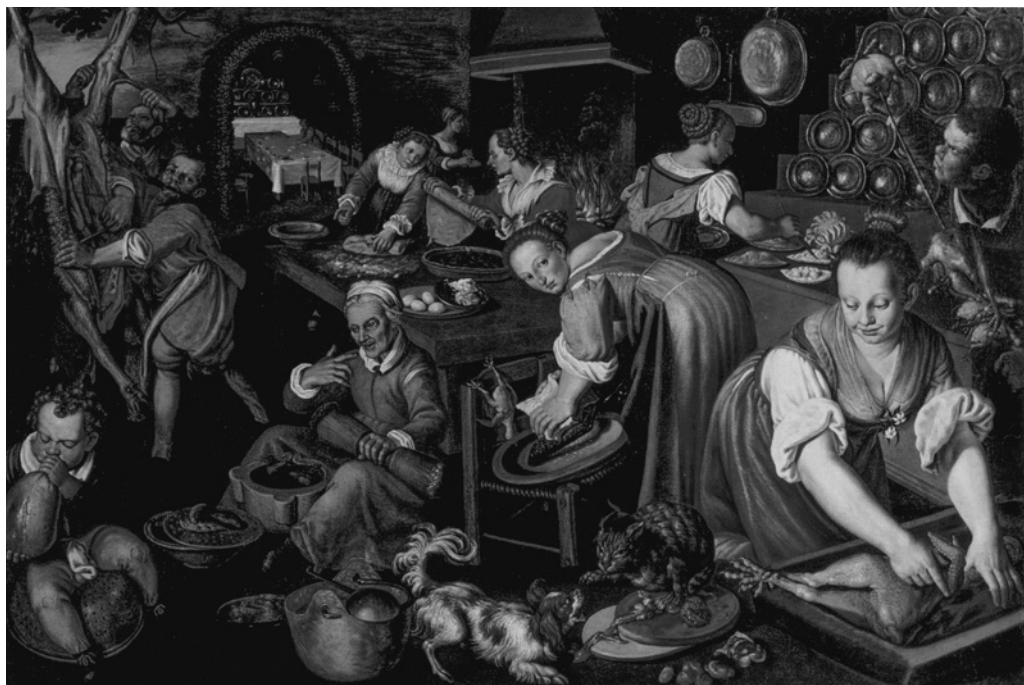
6. Vincenzo Campi, Cuisine , 1580 ca., huile sur toile, 145 x 220 cm, Milano, Pinacoteca di Brera

ces éléments inscrit le Cuisinier, servante et provisions dans une veine comique typique de la peinture nord italienne de la Renaissance. En Vénétie, Lombardie et Emilie-Romagne, les tableaux illustrant des scènes de marché, de cuisine, de boucherie et de repas se multipliaient dès la fin du seizième. Les personnages qui y présentent, manipulent, cuisinent ou consomment des aliments sont quasiment toujours traités de façon comique. Deux exemples picturaux, parmi beaucoup d'autres, peuvent être rapprocher des scènes de cuisine réalisées par Felice Boselli. Dans la Scène bachique (fig. 5) datée vers 1580 et attribuée à l'entourage de Niccolò Frangipane, le joueur de luth riant à pleines dents tourné vers nous semble le modèle du cuisinier tandis que dans la Cuisine (fig. 6) de Vincenzo Campi (1580) l'ambiance domestique et la gestualité genrée proposées inspirent notre tableau 15 .