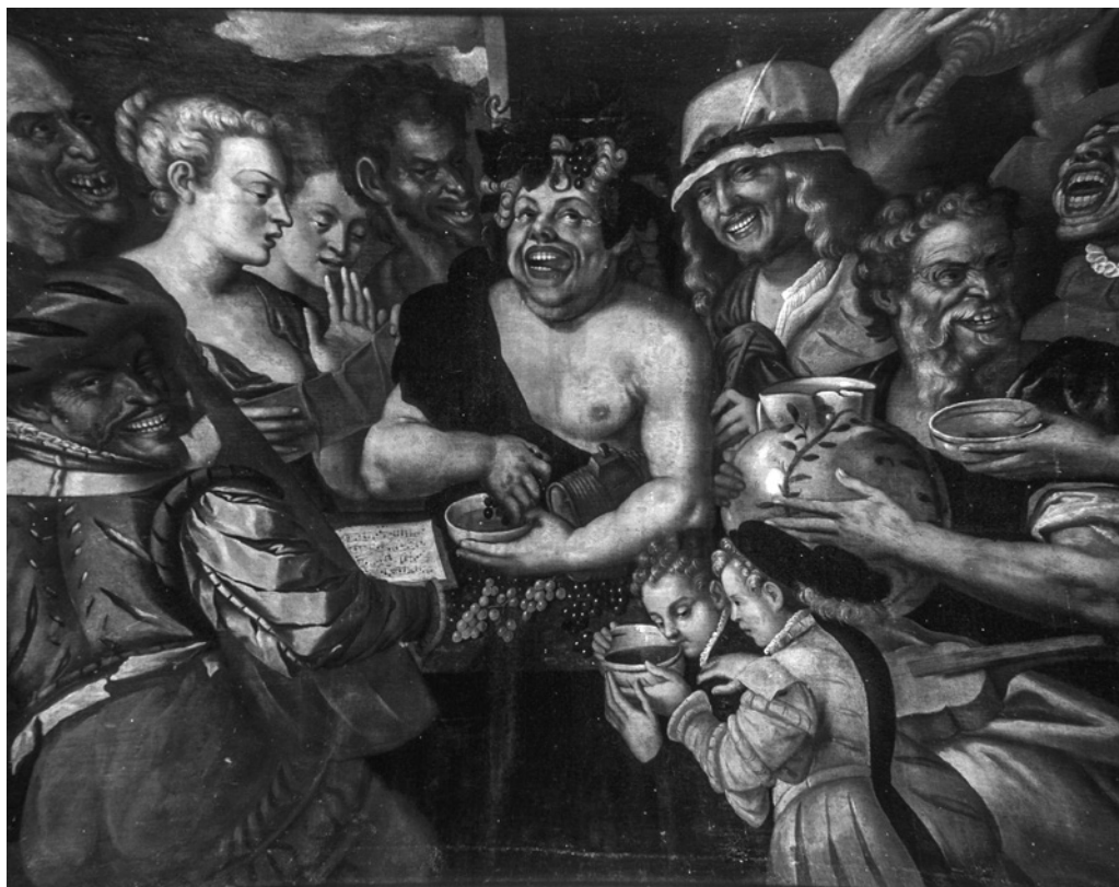
5. Niccolò Frangipane (entourage), Scène bachique , 1580 ca., huile sur toile, 119 x 153 cm, Soissons, Musée Saint-Léger

[ils] dévorent comme des loups, goûtant les saveurs de tous les aliments, [...] portant des blouses chargées de graisse et de gras, [...] mangeant à chaque heure et à chaque moment comme des affamés, [...] léchant, buvant, [...] souffrant de la fumée dans les yeux, du feu aux mains, la teinture à la moustache, l'ébriété à la tête, le vomi au ventre, fait réceptacle et sentine de toutes les ordures de la bouche 14 .