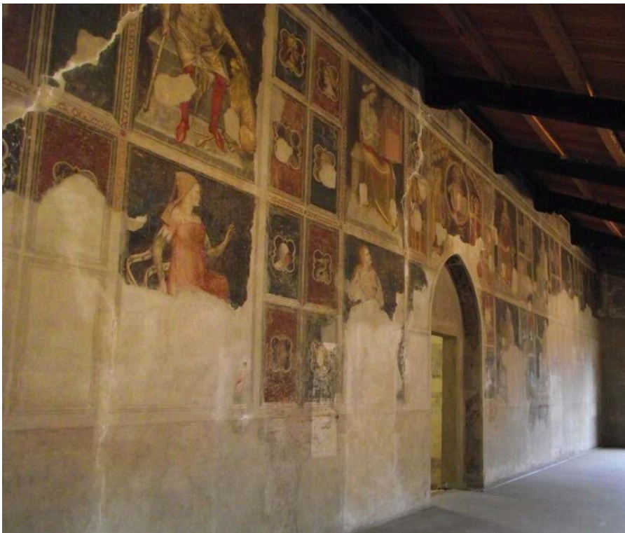
Ferrare, Palazzo Minerbi. B. Cosnet