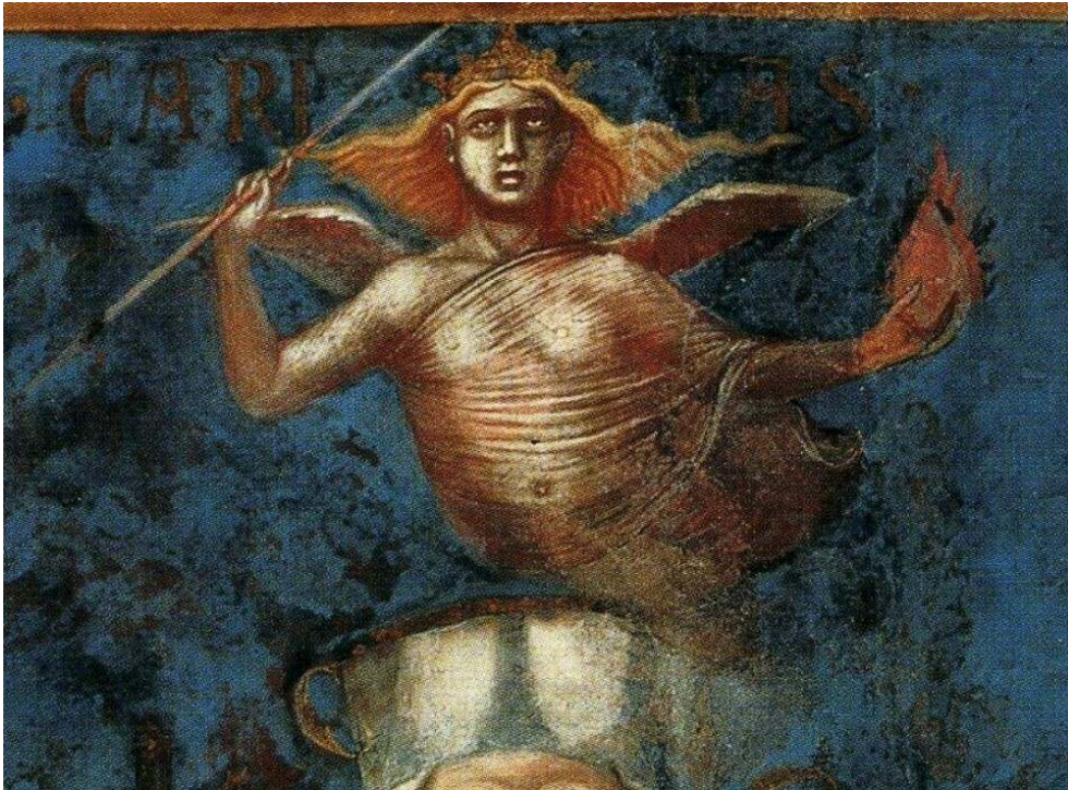
Sienna, Palazzo Pubblico, salle des Neuf.