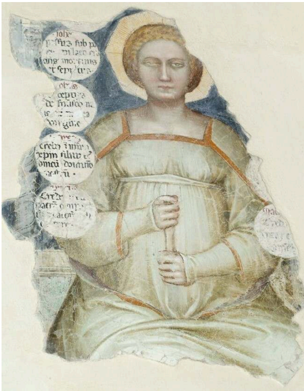
Padoue, Cortellieri des Eremitani. B. Cosnet.