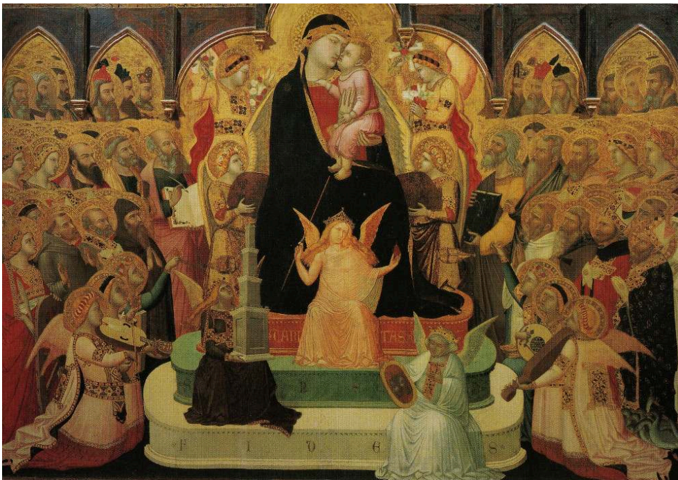
Massa Marittima, Palazzo del Comune. Wiki Loves Monuments Italia.