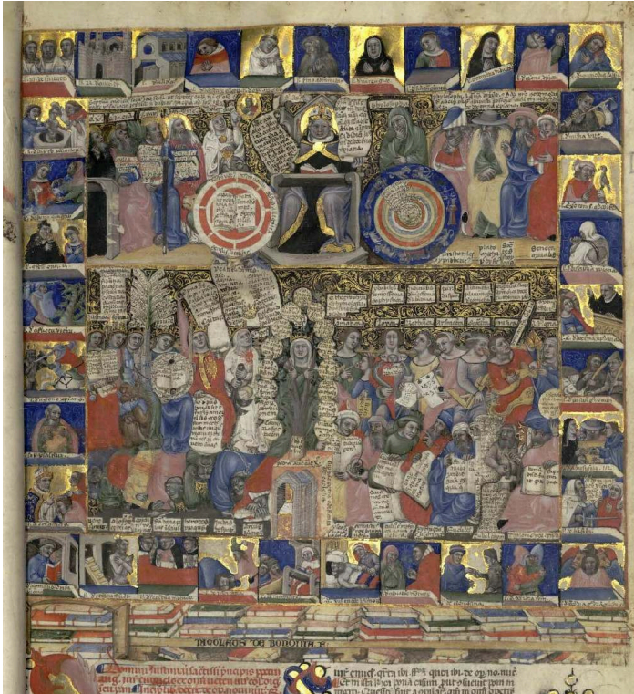
Fig. 6, Niccolò di Giacomo, Triomphe de saint Augustin, Commentaire du Digestum novum, vers 1370.

Madrid, Biblioteca Nacional de España, Ms. M 197, fol. 4.