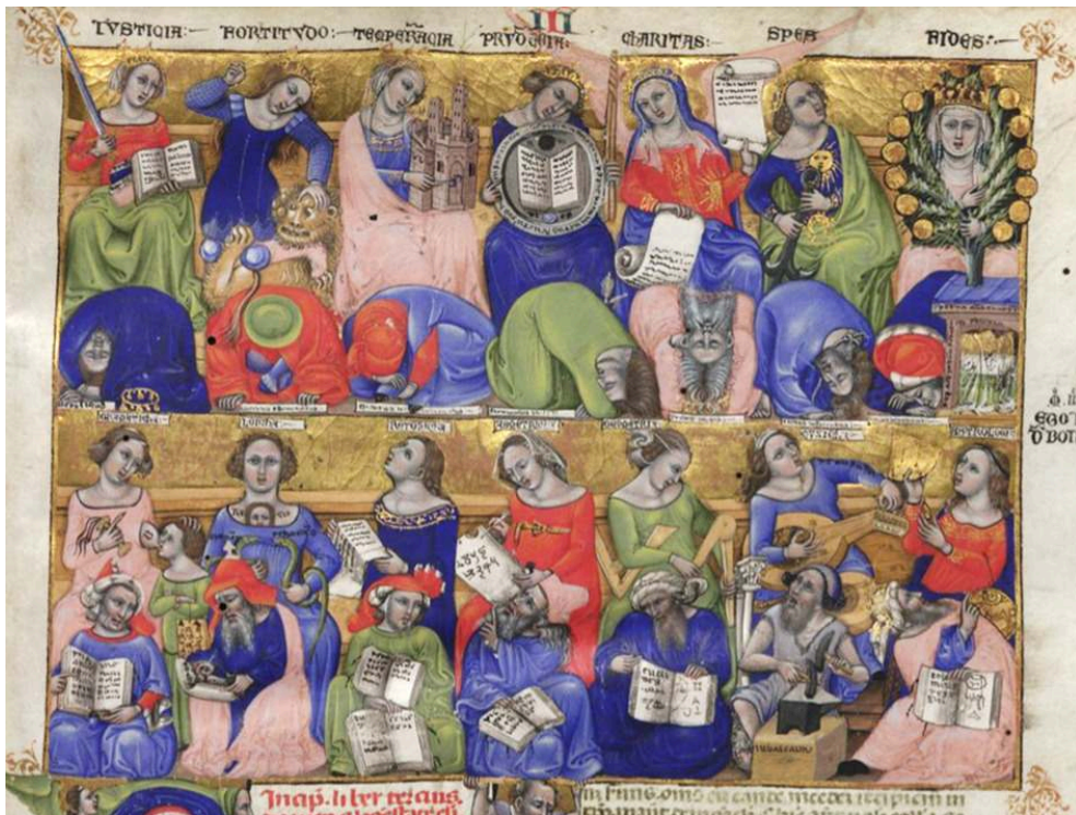
Milan, Biblioteca Ambrosiana, Ms. B 42 inf, folio 1.