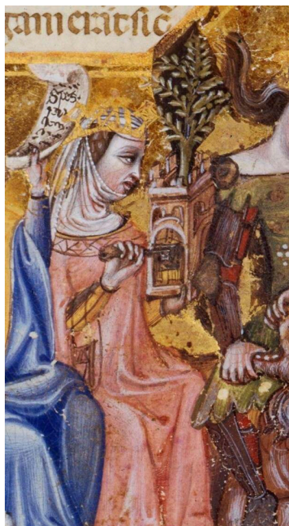
Paris, Bibliothèque nationale de France, Ms. Lat. 14339, folio 3.