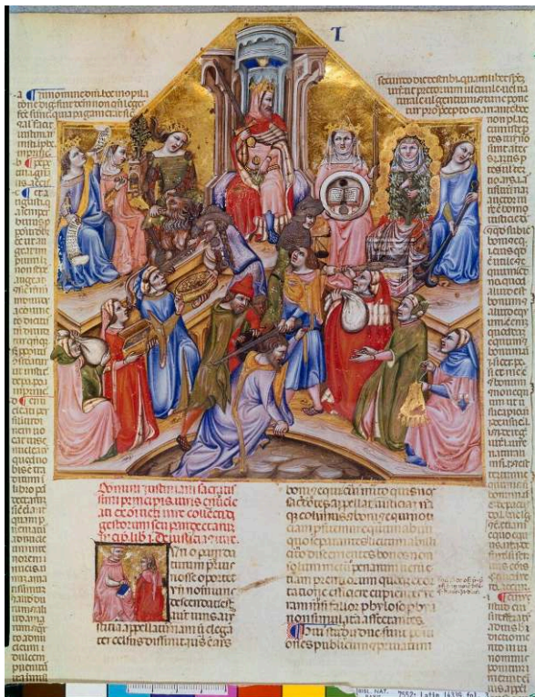
Fig. 1, Maître de 1346, Le tribunal de Justinien, Digestum vetus cum glossa Accursii, vers 1345.

Paris, Bibliothèque nationale de France, Ms. Lat. 14339, folio 3.