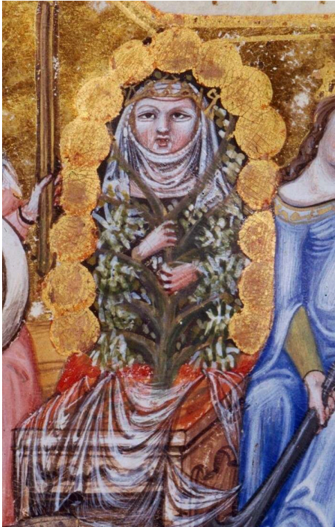
Paris, Bibliothèque nationale de France, Ms. Lat. 14339, folio 3.