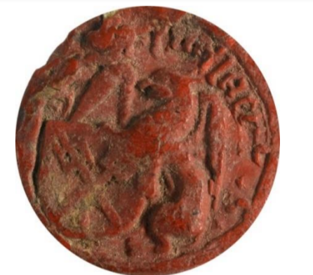
Sceau de Gérard Senellart Archives Départementales du Nord, 10H 163-2566

La combinaison des titulatures masculines et féminines (preuves indéniables de considération sociale) permet de porter un nouveau regard sur la société douaisienne sous l'angle du couple. La prise en compte des richesses familiales affine l'analyse. Le but est de mieux rendre compte des mobilités et immobilités sociales. Si certaines familles pénétrèrent les élites politiques en accédant à l'échevinage – plus ouvert qu'on ne le croit 7 – d'autres parvinrent à l'anoblissement ou entrèrent au service du duc. A Douai, les Senellart firent fortune grâce au brassage d'une bière légère type bacquebart . A la fin du XV e siècle, à force de persévérance (accumulation de patrimoine, constitution d'un réseau social, conclusion de mariages respectables), la famille accéda à la noblesse. Le 24 avril 1498, la demoiselle Isabelle Senellart fut mariée à l'écuyer Baudouin de Habarcq, futur bourgeois, qui finit par tenter l'expérience brassicole.