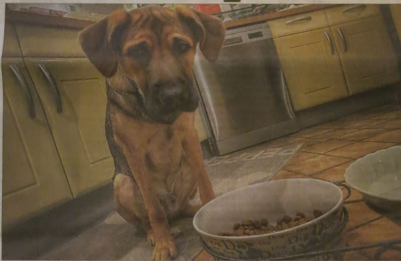
PAGES 2 ET 3

Selon un vétérinaire de Bourges, les croquettes bas de gamme ou les restes de la nourriture des humains ne sont pas forcément de bonnes solutions.