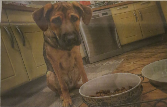
PAGES 2 ET 3

AVERTISSEMENT Selon un vétérinaire de Bourges, les croquettes bas de gamme ou les restes de la nourriture des humains ne sont pas forcément de bonnes solutions.