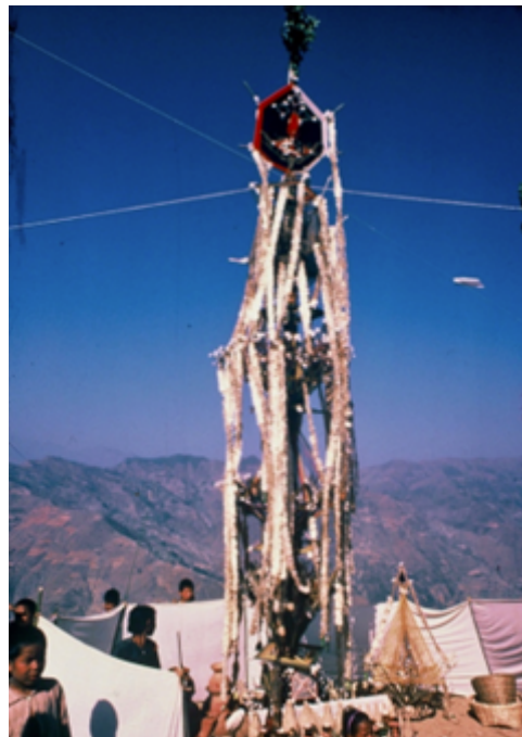
Fig. 12 La construction du pilier des ancêtres, le Toīla, planté sur le « Mont Rigyal Lhunpo », avec les figures ancestrales masculines et féminines superposées au sommet, et tous les différents paraphernalia offerts aux êtres maléfiques hostiles, de chaque côté de la construction. Cliché B. Steinmann, Temal Parsel, Népal, mai 1988.

Le rituel de 1988 consistait à réaliser une énorme figure anthropomorphe faite d'un empilement de polyèdres, entrelacs de fils ( mdos, nam mkha' ), enfilé sur un poteau de six mètres de haut ( fig. 12 ). Ce « pilier de mdos » est une effigie humaine très élaborée, véritable image allusive du corps humain fait de deux ancêtres, mâle et femelle, ainsi qu'une représentation du cosmos avec en son centre un dieu, le « dieu du mdos ». Toutes sortes de matériaux, substances végétales et animales qui constituent les offrandes habituelles faites lors des rituels sont amassées autour du corps de ce dieu. Cet assemblage complexe, ainsi que l'ensemble de l'action rituelle effectuée pendant sept jours et sept nuits, sont appelés Toīla : ce nom unique fait référence à la fois à l'adoration des dieux du clan, aux effigies de dieux en bambou et en coton entourées de piles d'offrandes, et au corpus de textes tibétains lus pendant la performance rituelle. Le culte Toīla est rendu exclusivement aux dieux du clan Bal, le plus important, donc, par le nombre de ses membres, son ancienneté dans la région et sa position prestigieuse de « donneur de femmes » à tous les autres clans Tamangs, comme on l'a dit plus haut.