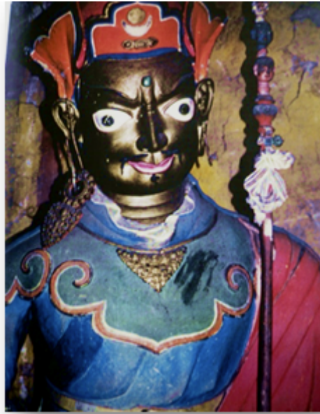
Fig. 4 Statue du Gourou Rinpoché en figure de magicien, alias Padmasambhava, apôtre du bouddhisme tibétain au Tibet et dans l'Himalaya. La statue, en bois polychrome représente le Gourou Rinpoché sous sa forme courroucée. Il tient son bâton tantrique rituel (sk. khatvanga). Cliché B. Steinmann, Walungchung gola, Népal, avril 1981.

de restauration actuel, après les destructions chinoises de la période maoïste. Cliché B. Steinmann, Tibet central, août 2008.