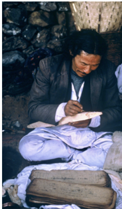
Fig. 17 Le lopon lama prépare un sceptre magique en bois (khram shing), avec lequel il « tuera » symboliquement les esprits hostiles. Il y inscrit des formules magiques (mantra) avec le sang de la chèvre. Cliché B. Steinmann, Temal Parsel, Népal, mai 1988.

Pendant la nuit, avant d'ériger le poteau des ancêtres, le maître-lama a déposé une natte au centre de la zone délimitant son emplacement, et a dessiné les contours du démon liṅga appelé Nakpo [11]. Ses seins sont nettement marqués, et le sexe est priapique[12]. Le démon est recouvert d'une gorma triangulaire placée sur un tissu blanc, puis le tout est placé sous un socle massif de terre, base de la montagne du Toīla. Le liṅga , une figurine anthropomorphe bisexuée en pâte de farine noire représente l'obstacle qui doit être détruit à l'aide des armes du lopon lama, sa dague rituelle ou phurba (sk. kīla ), son khram shing ( fig. 17 ), un sceptre magique fabriqué dans du bois, et son arme magique, une sorte de faucille tranchante appelée zor dans les rituels terribles. Les obstacles font référence à Gyalpo ( rGyal po ), roi des démons, ou énergie masculine négative, la colère et la rage, ainsi qu'à bsen mo , reine des démons, ou énergie féminine négative, l'attachement et le désir. Les Tamangs associent implicitement ces énergies maléfiques à certaines âmes de leurs ancêtres qui n'ont pas été apaisées après la mort en raison de mérites insuffisants, et qui continuent à tourmenter la famille et le clan.