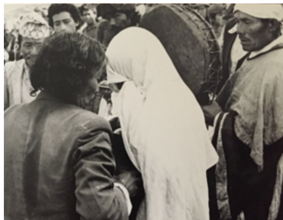
Fig. 19 Le lama glisse un pain de levure de bière sous le drap au bouc-émissaire, qui devra le brandir à la face des dieux du clan, en un geste considéré comme profanatoire. Cliché B. Steinmann, Temal Parsel, Népal, mai 1988.

Si le montreur de la levure, déguisé en femme, doit mourir, c'est parce qu'il a enfreint la règle qui interdit précisément aux femmes d'approcher les dieux du clan devant lesquels la mère de l'humanité a originellement autorisé l'inceste entre ses enfants, en consacrant leur union par la bière. Cet inceste est bien sûr inévitable car comment imaginer la reproduction dans l'altérité aux origines des temps ?