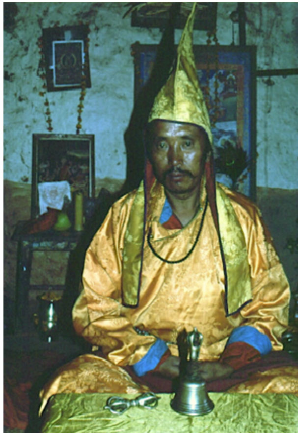
Fig. 1 Un lama tamang nyingmapa, en costume rituel de cérémonie, assis derrière son autel situé à l'étage de sa maison. Devant lui sont disposés la clochette rituelle et le sceptre ou « foudre diamant », dorje (tibétain rdo rje).

Dans les rituels de type tibétain effectués par des populations bouddhistes du Népal, des actions exorcistiques et magiques aident à libérer les défunts de l'emprise des forces du mal. On peut voir intervenir simultanément ou en parallèle aussi bien des prêtres bouddhistes lamas ( bla ma ) ( fig. 1 ), que des chamanes dits bompos ( fig. 2 ) ( bompo ) et des bardes appelés tamba ( gtam pa ). La question centrale pour tous est celle de « l'avenir des morts », la compréhension des causes du malheur et de la souffrance, et le rapport que l'on établit entre cette vie-ci, charnelle, sexuée et fugace, ses plaisirs et ses joies, et l'idée bouddhiste d'une souffrance permanente liée à l'enchaînement cyclique des existences et à la réincarnation ou samsāra [1]. Même la mort n'est pas la fin absolue des tourments.