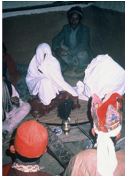
Fig. 18 L'homme choisi pour jouer le rôle du bouc émissaire est voilé et assis à l'intérieur de la maison, près de l'énorme "tormo" de riz, qui est offert par les habitants de la maison, cadeau collectif et rançon pour la restauration de la prospérité (yang).

supporte les effigies des dieux du clan. Les dieux eux-mêmes sont remariés. Le Toïla s'accompagne du culte des dieux de la terre et du sol (Sjipta : tib. gzhi-bdag ). De nombreux rites d'exorcisme sont ensuite effectués, avec pour principe d'offrir en rançon ( glud ) aux esprits hostiles les organes d'un animal sacrifié, sous la forme de la peau et de tous les organes d'une chèvre, et de treize oiseaux noirs. L'échange avec les entités maléfiques doit assurer la restauration de la force vitale ( yang ) du couple. De nombreuses offrandes de nourriture, qui font référence à toutes celles effectuées dans la parentèle lors des rituels du cycle de vie, ont lieu.