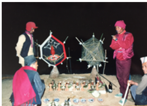
Fig. 20 Rituel du remariage des ancêtres sous la forme des effigies : symbole de la réconciliation de la société avec ses origines et de la pureté retrouvée du couple de la maison, qui a été remarié de la même façon. Les figures des ancêtres sont détruites et offertes aux démons ; les fils de laine du corps féminin de l'ancêtre sont redistribués aux femmes du lignage. Cliché B. Steinmann, Temal Parsel, Népal, mai 1988.

la face des dieux, un geste considéré comme profanatoire et qui entraînera plus tard sa mort symbolique. La victime est censée ignorer les conséquences désastreuses de son acte. Elle retournera dans son village immédiatement après avoir accompli sa tâche. Il lui est conseillé de mordre dans le pain de levure dissimulé sous le drap avant de le brandir à la face des dieux du clan. Cela affaiblira l'effet néfaste de son geste sur sa propre vie. En retour, cette pollution de l'offrande annule l'effet recherché sur les dieux. C'est en ces termes paradoxaux que s'exprime cette « mise à mort » symbolique du bouc-émissaire. Cependant, malgré ce conseil, tout le monde proclame que l'homme devra bel et bien disparaître, faute de quoi un membre de la famille qui célèbre le Toïla trouvera la mort. En réalité, le rituel de remariage du maître et de la maîtresse de maison, qui a été célébré par des circumambulations et des offrandes autour du pilier des ancêtres, trouve sa contrepartie avec celui des deux effigies des ancêtres ( fig. 20 ), qui va clore le rituel et signer la restauration de la pureté retrouvée et de l'effacement des fautes (incestes, ivrognerie, consommation de viande) susceptibles d'avoir occasionné le malheur dans la famille. Tout se terminera par des Saturnales ( fig. 21 ), et l'on continuera d'honorer annuellement les défunts en allant allumer des lampes à beurre sur les chorten , au sommet des montagnes ( fig. 22 ).