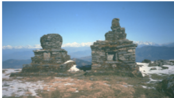
Fig. 22 Les anciens chorten ou reliquaires, au sommet de la montagne de Sailung en pays Tamang (Népal central, district de Doramba). On vient régulièrement y allumer des lampes à beurre pour les défunts de l'année. Montagne de Sailung, janvier 1988-avril 1992.