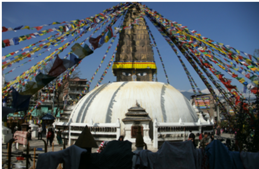
Fig. 7 Le stûpa de Chabahil, ou Dharmadeva, construit entre les 4 e et 6 e siècles de notre ère. Cliché B. Steinmann, Kathmandu, Népal, février 1995.

usages sociaux, de l'organisation de la société en clans exogamiques, avec tous les interdits d'alliance et les règles précises de commensalité, ainsi que la manière d'accumuler des mérites pour soi et pour les autres pendant l'existence. Par extension, on peut également tracer un lien, établi par les Tamangs eux-mêmes, entre leurs livres, leur territoire habité avec ses montagnes et ses reliefs (la terre sa , le pays yul ), et les lignées claniques liées à « l'os » du père ( rus ), toutes idées et représentations de l'environnement et du corps humain encastrées dans la notion de « doctrine ».