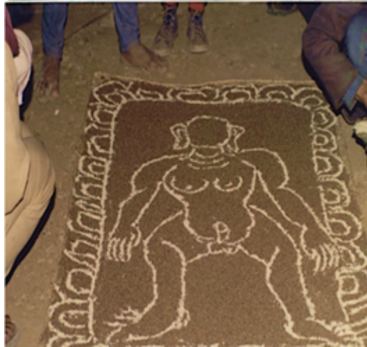
Fig. 10 Le liṅga, anthropomorphe et bisexué, couché sur le dos, dessiné sur le sol avec de la farine de sarrazin, par le lama-enseignant (slob dpon bla ma). Il sera pressé sous la structure globale du pilier constitué des effigies des ancêtres. Cliché B. Steinmann, Temal Parsel, mai 1988.

' cham ) se différencient des traditions bouddhiques tibétaines en détruisant un liṅga anthropomorphe renvoyant à Śiva (le Mahādeu népalais) et à plusieurs de ses aspects érotiques et ascétiques[6] ; de l'autre, un liṅga bisexué à figure humaine, pourvu de seins et d'un sexe priapique ( fig. 10 ) que les lamas tamangs écrasent et exorcisent sous le pilier des ancêtres lors du rituel éponyme, fait référence non pas à l'ennemi de la religion, comme au Tibet, ni non plus, strictement, au liṅga de Śiva comme « phallus » associé à la « yoni » ( fig. 11 ), mais à des idées populaires sur le partage du mal dans la société et les causes du malheur, attribuées surtout à un pouvoir destructeur de divinités-racines au féminin, les Mamo[7].