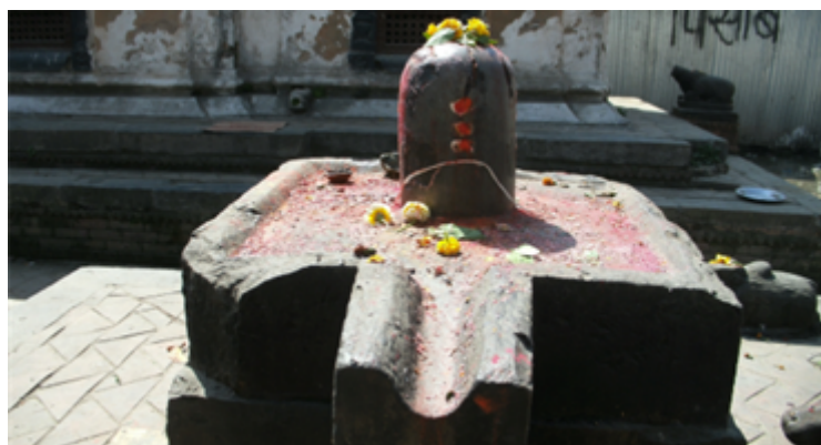
Fig. 11 Le liṅga du dieu Shiva érigé sur la yoni de la déesse : forme indo-népalaise de monument représentant l'union sexuelle entre Śiva et sa parèdre (Kathmandu). 1992, ville de Kathmandou, Népal.