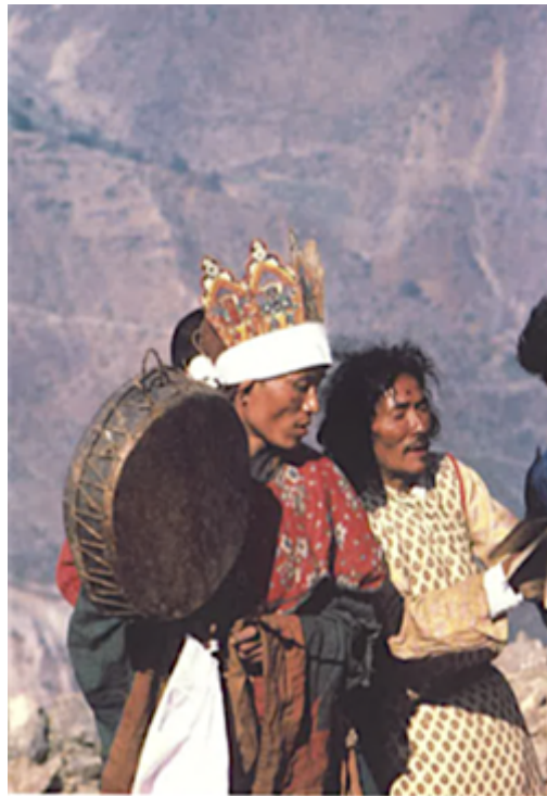
Fig. 13 Début des lectures du lopon lama et de son assistant, circumambulant autour du pilier des ancêtres. Temal Parsel, Népal, mai 1988.

liṅga plusieurs fois, le coupant en morceaux qui sont offerts à la divinité protectrice ( Yidam ).