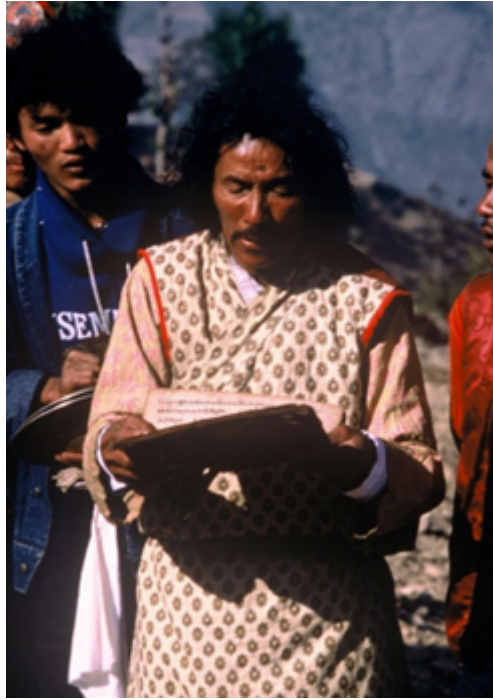
Fig. 8 Le lama-enseignant (slob dpon bla ma) lit le livre des généalogies des clans tamangs (tungrap). Temal Parsel, Népal, mai 1988.

Nous allons donc décrire et analyser ici les grands principes qui président aux rituels de vie et de mort, à travers les funérailles et surtout, le culte des ancêtres des clans, qui résume tous les autres. Nous évoquerons brièvement auparavant l'importance des influences hindoues qui sont mêlées à ces rituels bouddhiques.