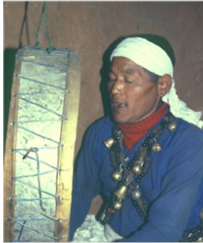
Fig. 2 Un chamane tamang, ou bompo, dans une séance de cure, commence à frapper son tambour (nga). Il convoque ses déités auxiliaires pour l'aider à rechercher « l'âme » (bla) du patient. Cliché B. Steinmann, Temal Parsel, Népal, mai 1980.

Nous analysons ici les réponses qui sont données à cette alternance et à ces tensions entre plaisir et douleur, Éros et Thanatos, dans les grands rituels funéraires et ancestraux de populations bouddhistes du Népal en particulier les Tamangs. Leurs pratiques bouddhistes tibétaines spécifiques et très anciennes sont liées à la fois à de grands rituels funéraires, sur le modèle du Livre des Morts Tibétains, le Bardo Thödol , et à des pratiques chamaniques et des rituels d'exorcismes contre les formes variées du malheur, réifiées sous l'aspect de multiples entités invisibles que l'on combat et exorcise. Dans ce panthéon, la présence des anciennes divinités hindoues est également importante, et se manifeste à travers les avatars indo-népalais de Śiva et de Viṣṇu, partagés aussi par d'autres populations du Népal.