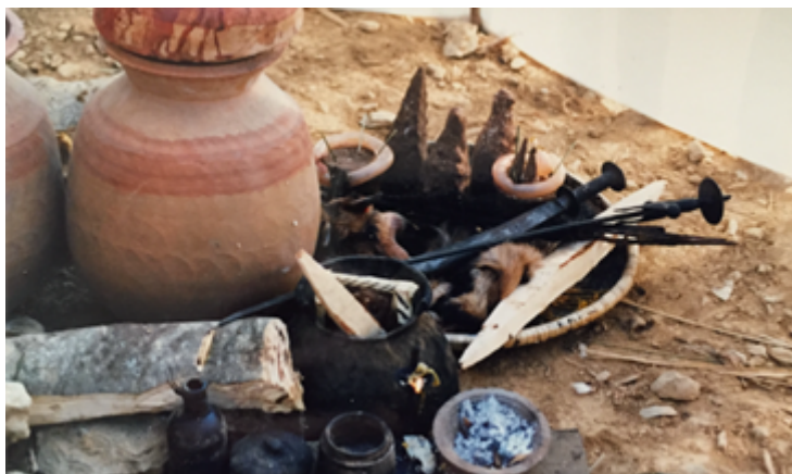
Fig. 16 Le palais dérisoire de la Mamo, au centre des actions terribles. Enfermée dans une jarre ébréchée et noircie de cendres, elle est entourée des rançons offertes : les boyaux de la chèvre, l'alcool dans la jarre, et des instruments rituels du lama, sceptre en bois et armes de métal. Cliché B. Steinmann, Temal Parsel, Népal, mai 1988.

chasser les numina hostiles à la famille. Ils dansent ensuite en brandissant la peau de chèvre ( fig. 15 ), pièce principale qui sert de rançon pour racheter l'âme ( bla ) de la mère de famille et de ses petits-enfants.