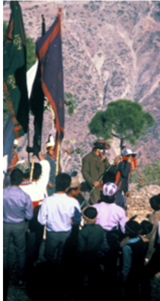
Fig. 21 Saturnales finales, avec scènes de la vie ordinaire parodiant les institutions, en particulier les rôles subalternes des Tamangs dans la cité et en politique. Les gendres jouent en général le rôle de bouffons. Temal Parsel, Népal, mai 1988.