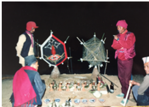
Fig. 20 Rituel du remariage des ancêtres sous la forme des effigies : symbole de la réconciliation de la société avec ses origines et de la pureté retrouvée du couple de la maison, qui a été remarié de la même façon. Les figures des ancêtres sont détruites et offertes aux démons ; les fils de laine du corps féminin de l'ancêtre sont redistribués aux femmes du lignage. Cliché B. Steinmann, Temal Parsel, Népal, mai 1988.

la face des dieux, un geste considéré comme profanatoire et qui entraînera plus tard sa mort symbolique. La victime est censée ignorer les conséquences désastreuses de son acte. Elle retournera dans son village immédiatement après avoir accompli sa tâche. Il lui est conseillé de mordre dans le pain de levure dissimulé sous le drap avant de le brandir à la face des dieux du clan. Cela affaiblira l'effet néfaste de son geste sur sa propre vie. En retour, cette pollution de l'offrande annule l'effet recherché sur les dieux. C'est en ces termes paradoxaux que s'exprime cette « mise à mort » symbolique du bouc-émissaire. Cependant, malgré ce conseil, tout le monde proclame que l'homme devra bel et bien disparaître, faute de quoi un membre de la famille qui célèbre le Toïla trouvera la mort. En réalité, le rituel de remariage du maître et de la maîtresse de maison, qui a été célébré par des circumambulations et des offrandes autour du pilier des ancêtres, trouve sa contrepartie avec celui des deux effigies des ancêtres ( fig. 20 ), qui va clore le rituel et signer la restauration de la pureté retrouvée et de l'effacement des fautes (incestes, ivrognerie, consommation de viande) susceptibles d'avoir occasionné le malheur dans la famille. Tout se terminera par des Saturnales ( fig. 21 ), et l'on continuera d'honorer annuellement les défunts en allant allumer des lampes à beurre sur les chorten , au sommet des montagnes ( fig. 22 ).