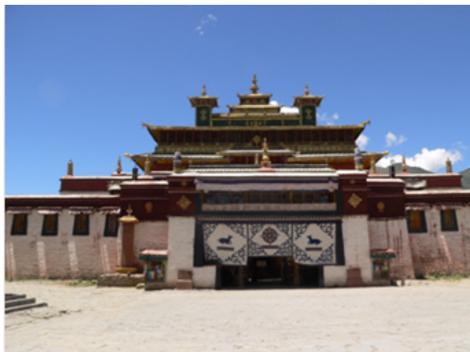
Fig. 3 Le monastère de Ui Samye (tib. Dbus Bsam yas ), fondé au Tibet par Padmasambhava vers 779 de notre ère, dans son état