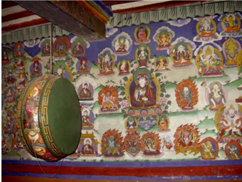
Fig. 6 Peinture du Gourou Rinpoché, entouré des déités principales des nyingmapa, sur les murs du petit monastère (gompa) tamang de Temal Parsel, Népal. Cliché B. Steinman, juin 1990.

Globalement, la doctrine bouddhique, base de toute exigence éthique et que l'on peut assimiler au dharma hindou, est donc présentée comme une exigence morale fondamentale en termes de services rituels effectués dans le cadre de la parenté, de dons de nourriture, de solidarité rituelle dans le clan, d'échanges de travaux n'impliquant pas d'argent, d'accumulations d'actes méritoires kewa (tib. dge' ba ) qui permettent à l'individu de sortir dignement de la vie grâce notamment au réseau le plus large possible des indispensables parents, cognats et affins qui contribuent à ce que le « principe conscient » du défunt ou namsje (tib. Rnam 'dbyed ), que les lamas extraient du sinciput au moment du décès, prenne la bonne direction.