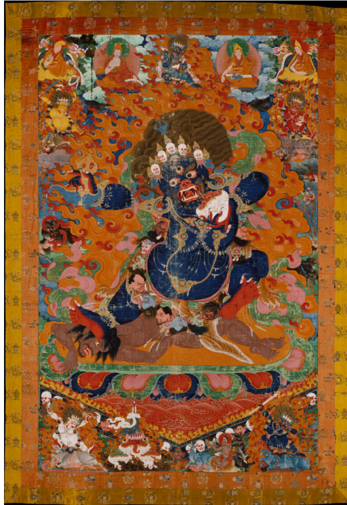
Fig. 9 Gshin rje ou Yama Raja, le roi des Enfers, dans la cosmographie bouddhique tibétaine. Début du XVIIIe siècle, 184.2 × 118.4 cm , Metropolitan Museum of Art, New York.

Différents artefacts, images-effigies et figures mythologiques renvoient aux mondes indiens et tibétains, et en particulier les démons à forme humaine comme le liṅga (sanskrit[4], tib. ling ga ), qui jalonnent la vie religieuse de ces populations bouddhistes du Népal. Ils servent d'autant d'exutoires au malheur, sous la forme d'entités que l'on élimine, exorcise, voire même tue[5]. Le recours à ces subterfuges permet de venir à bout des obstacles récurrents de la vie humaine individuelle et sociale : infortune, stérilité, mauvais sorts, maladies, malediction, accidents de toutes sortes. Ces actions sur des entités démoniaques rendues « visibles » à l'aide de supports variés, aident les prêtres, lamas et chamanes, à prendre directement en charge les maladies, et in fine , à traiter le défunt mais aussi les vivants.