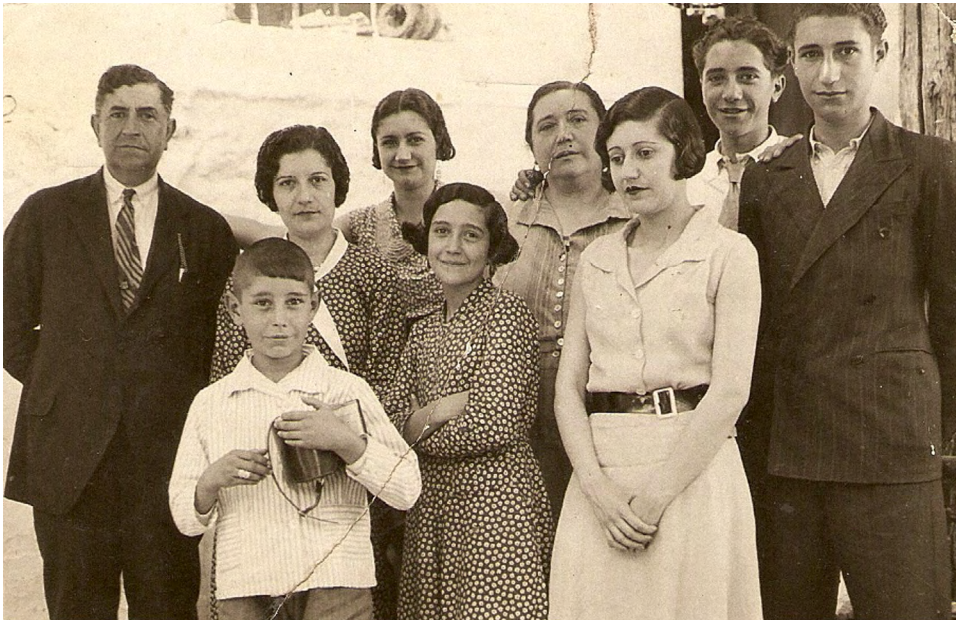
Foto 3.—Con su familia en Arenas de San Pedro, 1932.