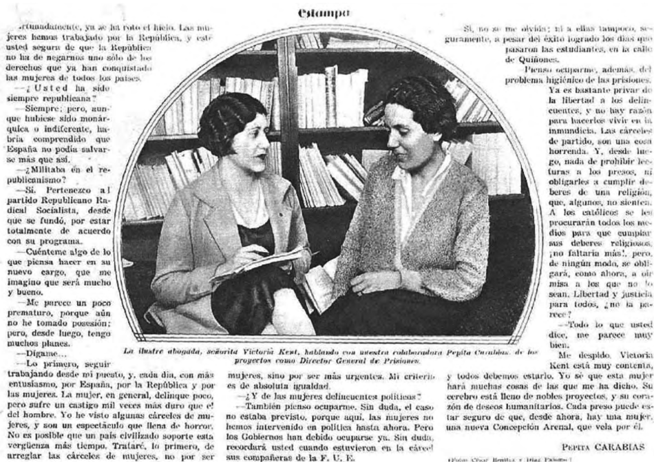
Foto 6.—“La primera mujer española que ocupa un cargo público”, Estampa , 18 de abril 1933.

Josefina Carabias su entrevista a Victoria Kent recién nombrada directora general de prisiones.