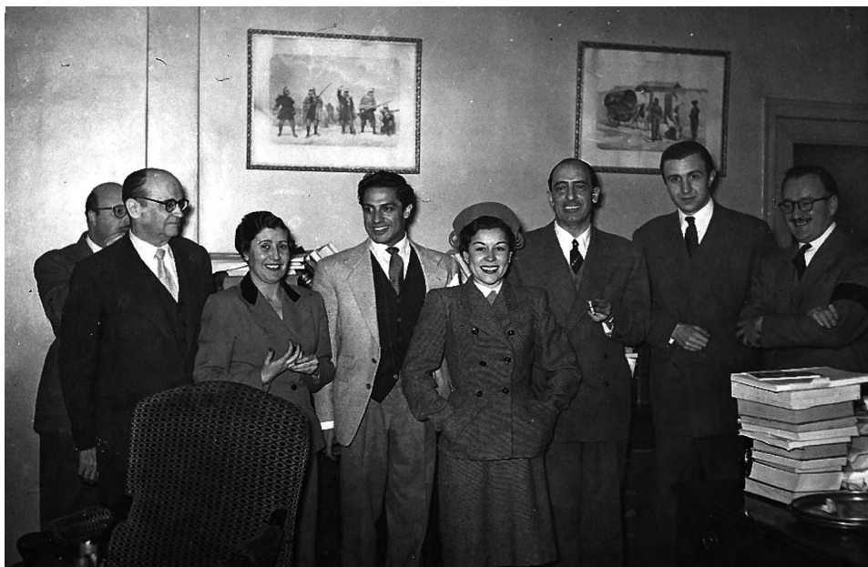
Foto 10.—En la redacción de Informaciones 1952.

Gracias al premio todo cambió en su vida: empezaron a llegarle ofertas de trabajo y su situación económica, hasta entonces precaria al extremo, mejoró sustancialmente. Pero lo más importante fue la señal de que “no estaba mal visto” considerarla como periodista y escritora de ley [...] de que se la podía invitar a dar conferencias, de que se le podían encargar colaboraciones en las revistas prestigiosas, de que se podía proponer su nombre cuando de alguna embajada extranjera solicitaban una periodista para el viaje al país [...] 46 .