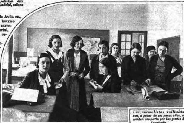
Las normalistas vallisoletanas, a pesar de sus pocos años, no sienten simpatía por las gentes de izquierda.

A dos kilómetros de un pueblecito de la provincia de Avila, encontramos una mujer que caminaba detrás de un horriero cargado de leña. Al verme parados en medio de la carretera se detuvo y se dirigió a nosotros con aire jovial. —¿Qué les pasa a ustedes? Es posible que se les ha estropeado el atomocil. Vaya, el mío no marra... La mujer era simpática, y después de haberse pasado la tarde sola en el campo haciendo leña, tenía ganas de conversación. —Si ustedes creen que yo les puedo ayudar en algo —continuó—, aquí estoy pa todo lo que gusten de mandar, y si la señorita tiene prisa por llegar al pueblo, yo no puedo hacer más que dejar aquí la leña y llevarla en el burro. —No..., déjelo..., esto va a ser cosa de poco tiempo... —¿Y eso qué importa? La señorita se viene conmigo en el burro y luego, si el chameje arregla eso pronto y nos ataja, pos con amonitarse otra vez en el auto..., lo arreglo. Tal acento de sinceridad puso la pobre mujer en sus palabras que me hizo aceptar, con la condición de que no descargara la leña. Yo iría con ella caminando detrás del burro. —Este pueblo está muy revolucionario—me iba di-