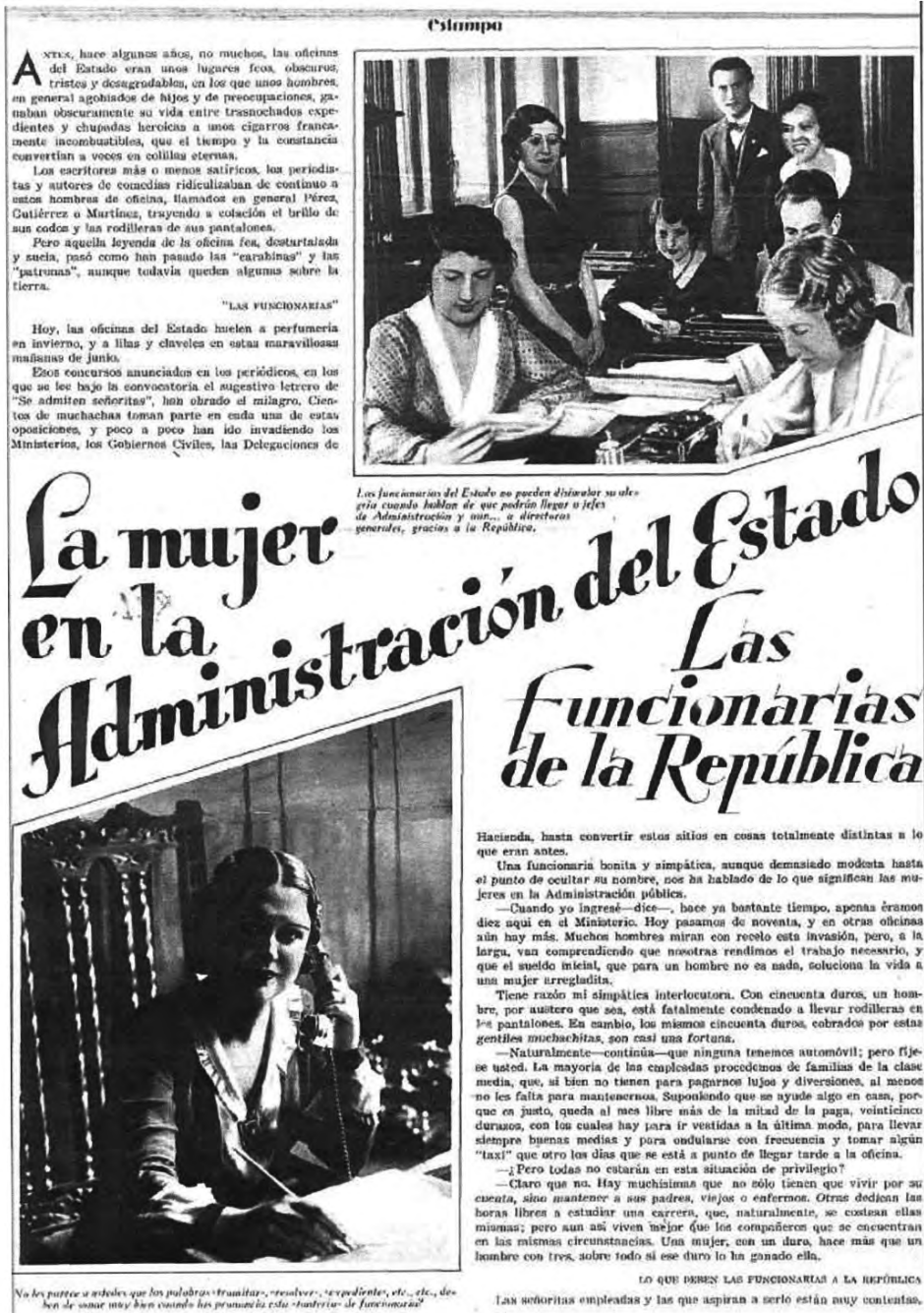
Foto 7.—"La mujer en la Administración del Estado. Las funcionarias de la República". Estampa 11 de junio 1932.