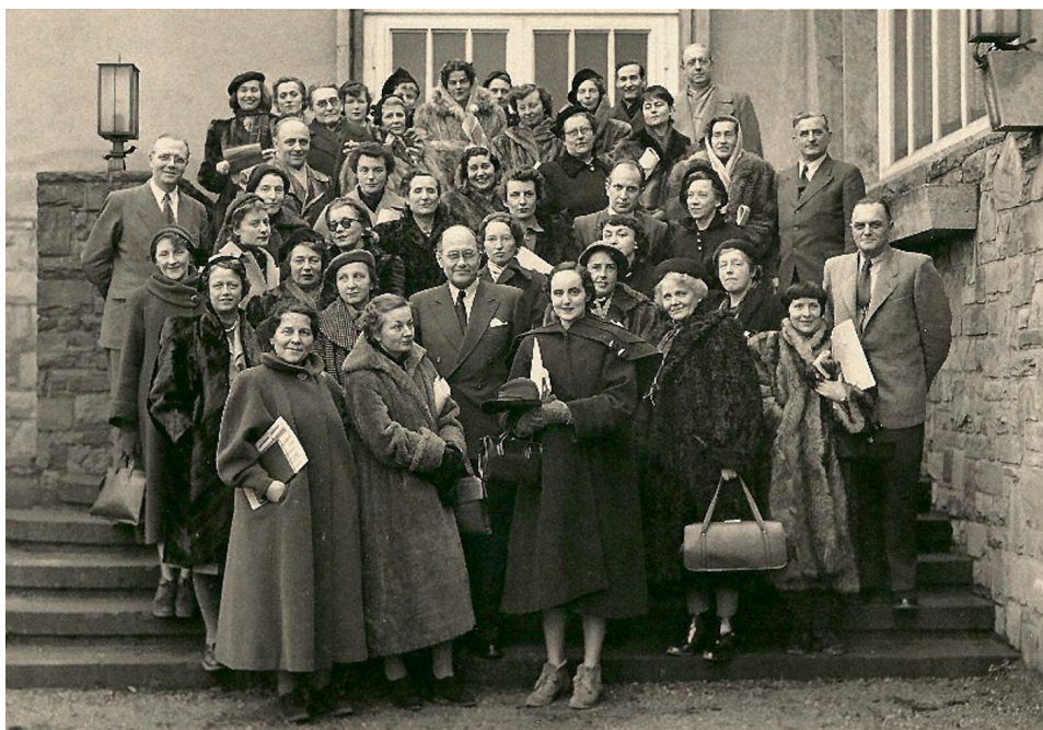
Foto 12.—Encuentro en Bad Hombourg, 1953.