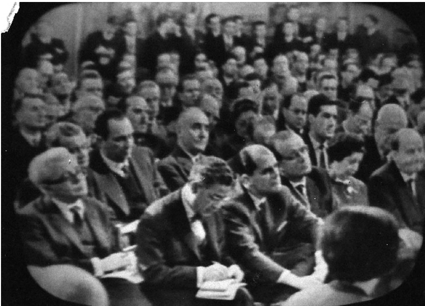
Foto 15.—Josefina Carabias entre periodistas varones durante la conferencia de prensa televisada de John Fitzgerald Kennedy en Par3s, 1961.