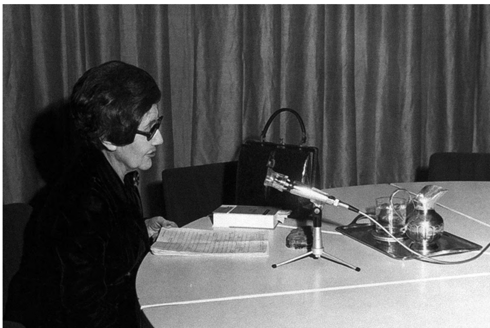
Foto 18.—Dando una conferencia sobre el Código Civil, posiblemente 1975, [s.l.].

Cuando se abre el año 1975, declarado “Año internacional de la mujer”, invita a las mujeres que pueden, a las que como suele decirse “cuentan” a tomar la palabra en nombre de todas las que se encuentran desamparadas ante las leyes. Afirma estar dispuesta a traer “su granito de arena al asunto” dando cuenta de caso concretos 77 . Sin perder una pizca de humor, el tono se vuelve más exigente e impaciente en marzo de 1975 ante las reformas pendientes y frente a la celebración del “Año” encomendada en España a la Sección Femenina: