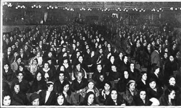
La propaganda política llama hoy de inmediato a la mujer. Vean el aspecto del Teatro Calderón, de Valladolid, durante un mitin tradicionalista.

N UESTRA colaboradora Josefina Carabias ha recorrido varias provincias castellanas y numerosas pueblitos del Norte para dar a conocer a los lectores de ESTAMPA la actitud de las mujeres españolas ante las contiendas políticas, en las que han sido invitadas a intervenir por la República que les ha concedido el voto. Por primera vez, mañana, las mujeres españolas harán uso del derecho del sufragio. Veas en el reportaje que publicamos a continuación lo que opinan las nuevas electoras.