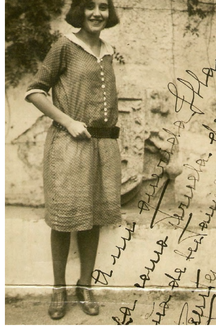
Foto 2.—Sola en Arenas de San Pedro, 1923.