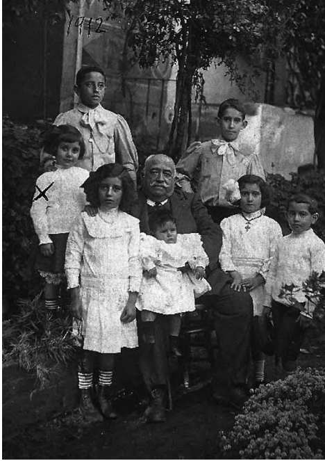
Foto 1.—Con su abuelo, 1912.