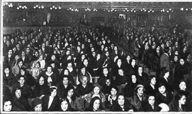
La propaganda política llama hoy de inquietud a la mujer. Vean el aspecto del Teatro Calderón, de Valladolid, durante un mitin tradicionalista.

N UESTRA colaboradora Josefina Carabias ha recorrido varias provincias castellanas y numerosas pueblitos del Norte para dar a conocer a los lectores de ESTAMPA la actitud de las mujeres españolas ante las contiendas políticas, en las que han sido invitadas a intervenir por la República que les ha concedido el voto. Por primera vez, mañana, las mujeres españolas harán uso del derecho del sufragio. Veas en el reportaje que publicamos a continuación lo que opinan las nuevas electoras.