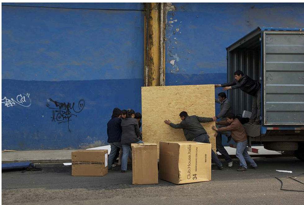
Tirage fine art sur papier baryté 310 g/m 2 , marges blanches (52 x 41,5 cm), prise de vue 2010.