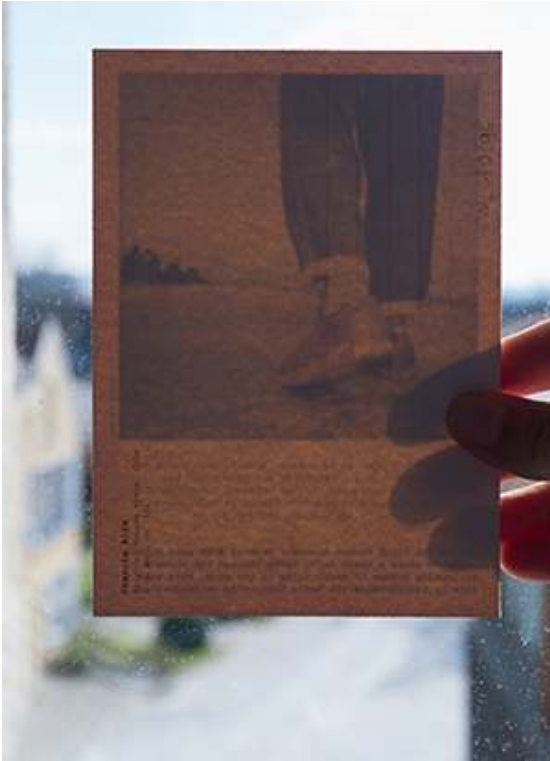
Tirage fine art sur papier baryté 310 g/m 2 , marges blanches (52 x 41,5 cm), prise de vue 2016.