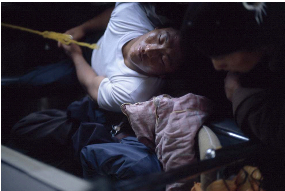
Tirage fine art sur papier baryté 310 g/m 2 , marges blanches (52 x 41,5 cm), prise de vue 2005.

Aurélié Pétrel, « Prise de vue latente #0009 », 2011