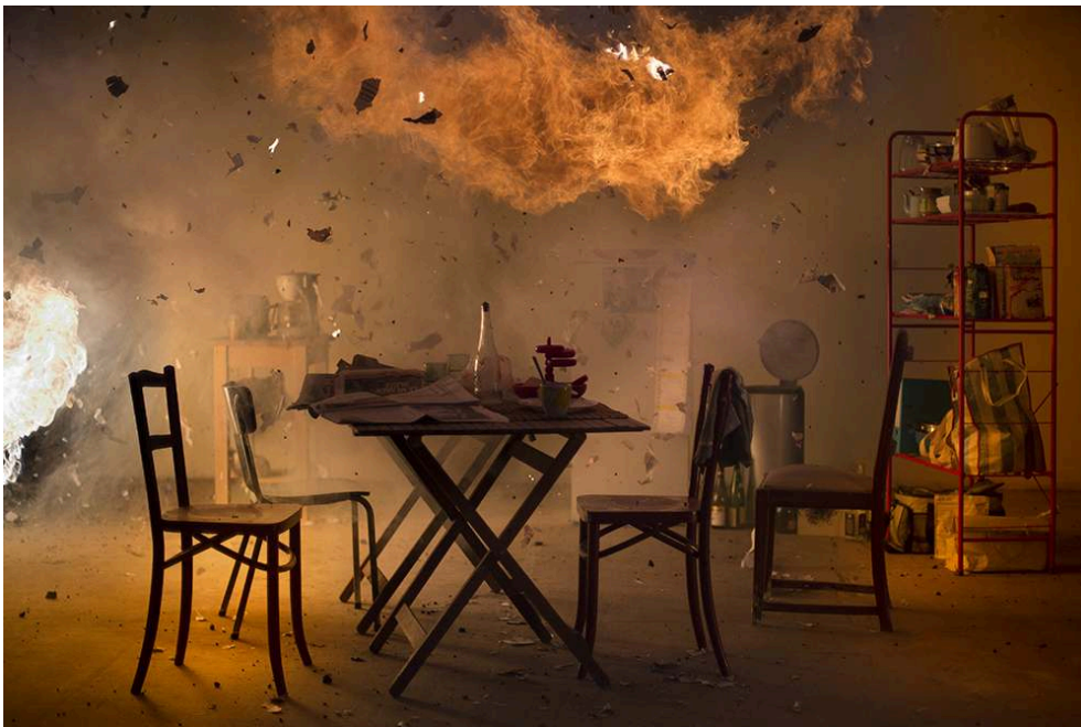
Tirage fine art sur papier baryté 310 g/m 2 , marges blanches (52 x 41,5 cm), prise de vue 2013.

Aurélié Pétrel, « Prise de vue latente #0164 », 2015