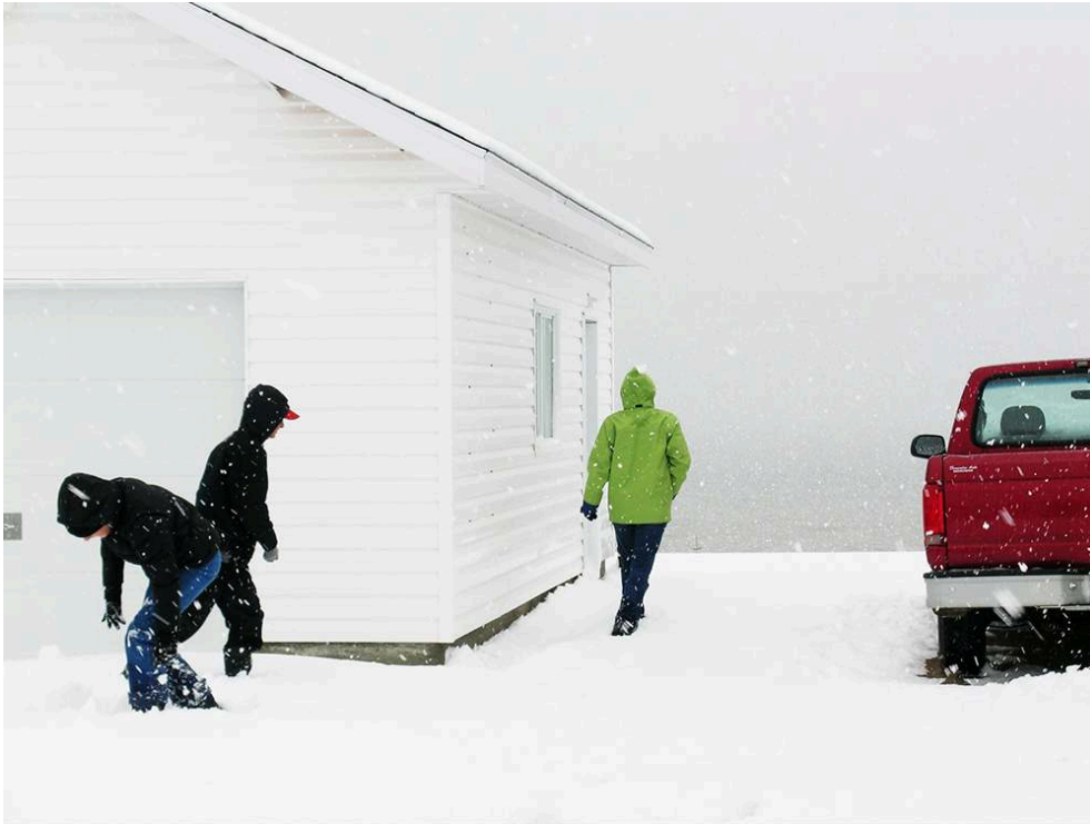
Tirage fine art sur papier baryté 310 g/m 2 , marges blanches (52 x 41,5 cm), prise de vue 2005.