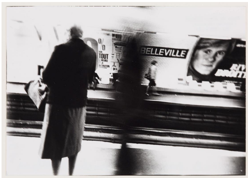
Figure 3. Capitale paysage , photogrammes, archives Michel Nedjar, LaM.