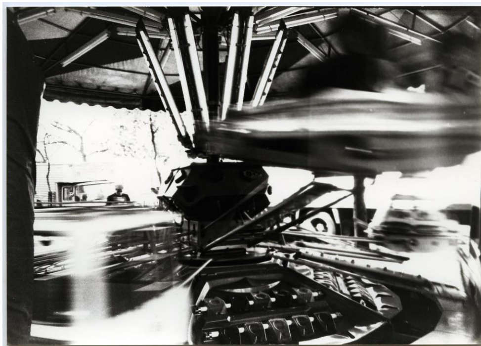
Figure 2. Capitale paysage , photogrammes, archives Michel Nedjar, LaM.