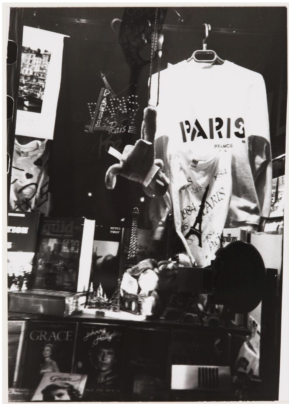
Figure 1. Capitale paysage , photogrammes, archives Michel Nedjar, LaM.