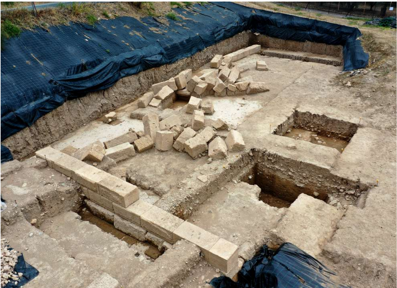
6. Τοίχος κατασκευασμένος από ασβεστολιθικούς δόμους, στα ανατολικά της στοάς.

Κατά τους αυτοκρατορικούς χρόνους και κυρίως κατά τη διάρκεια του 2ου αι. μ.Χ., το ιερό γνώρισε νέα περίοδο άνθησης. Πολυάριθμα νομίσματα