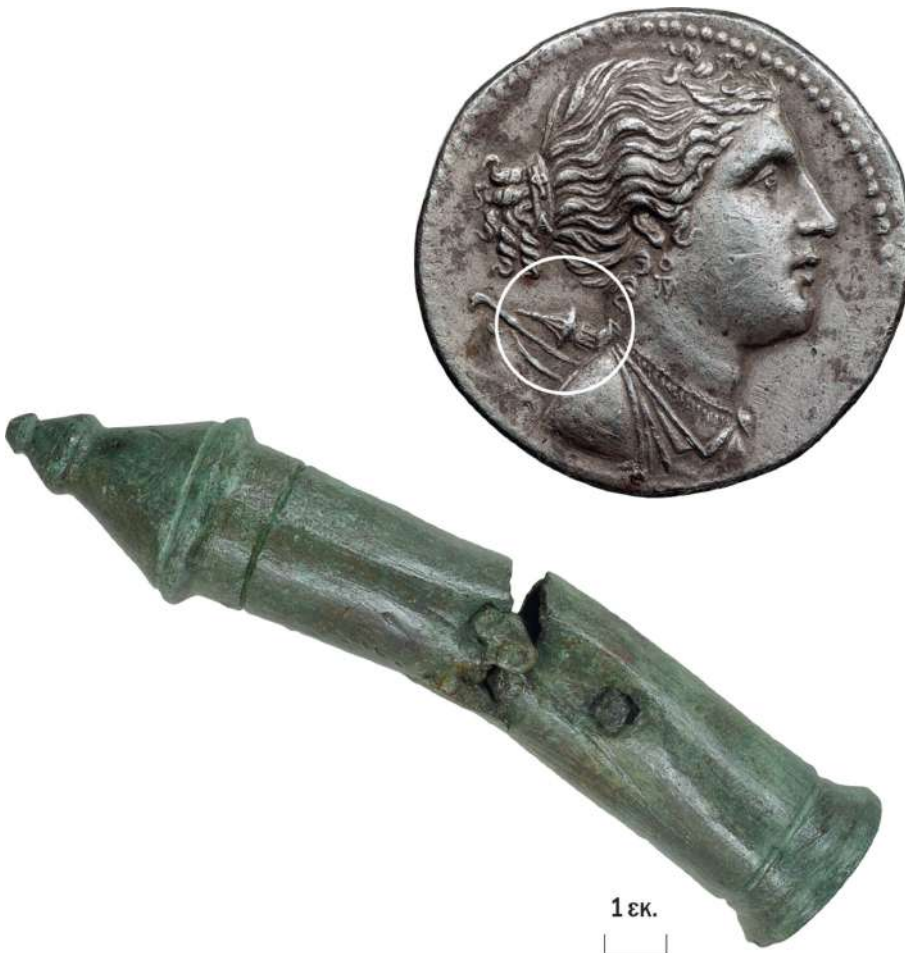
5. Κάτω: χάλκινη φαρέτρα από το ιερό της Αμαρυσίας Αρτέμιδος. Άνω: τετράδραχμο της Ερέτριας, στο οποίο η θεά Άρτεμις φέρει όμοια φαρέτρα.

Εάν το κτήριο 6 μπορεί να ταυτιστεί με ναό, πράγμα πολύ πιθανό, αντιθέτως η χρήση μιας ομάδας μικρών κτηρίων στα νότια του (εικ. 2 αρ. 8) παραμένει ακόμα σκοτεινή. Πρόκειται άραγε για μικρούς θησαυρούς, όπως αυτοί που έχουν βρεθεί στα μεγάλα ιερά των Δελφών και της Ολυμπίας; Μόνο η συνέχιση της ανασκαφής θα μπορούσε να δώσει απαντήσεις σε αυτό το ερώτημα.