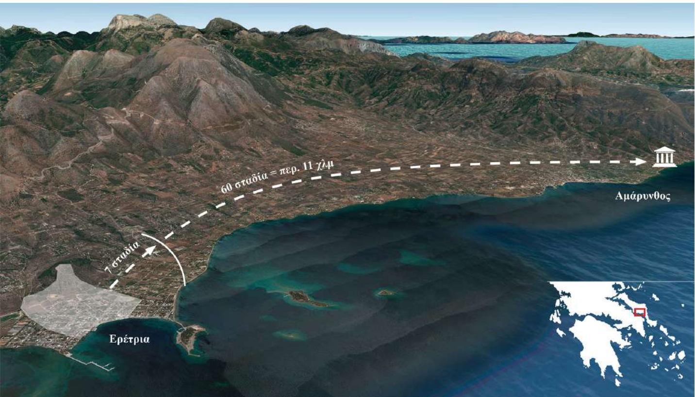
1. Χάρτης (από Google earth) με την απόσταση του Ιερού της Αρτέμιδος από την Ερέτρια. Ο χάρτης σχεδιάστηκε από την ESAG/ΕΑΣΑ.

Η ύπαρξη του ιερού της Αμαρυσίας Αρτέμιδος στην Αμάρυνθο Ευβοίας ήταν γνωστή μόνο από τις γραπτές πηγές. Κατ' αρχήν, πρέπει να αναφέρουμε τον γεωγράφο Στράβωνα, ο οποίος συνέγραψε τον 1ο αι. π.Χ. το μεγάλο έργο του για τη γεωγραφία του αρχαίου κόσμου. Στο πρώτο κεφαλαίο του 10ου βιβλίου, αφιερωμένου στη γεωγραφία της Ευβοίας, μνημονεύει πολλές φορές το εν λόγω ιερό. Σε μία παράγραφο (X, 1, 12), αναφέρει μία συμφωνία, η οποία καθορίζει τις συνθήκες μάχης μεταξύ των πόλεων της Ερέτριας και της Χαλκίδας. Αυτή η συμφωνία, με την οποία οι δυο πόλεις αποδέχονται να μην χρησιμοποιούν τηλεβόλα όπλα, ήταν γραμμένη σε μια στήλη που είχε ανεγερθεί στο ιερό της Αμαρύνθου ( έν τῷ Ἀμαρυνθίῳ στήλῃ ).