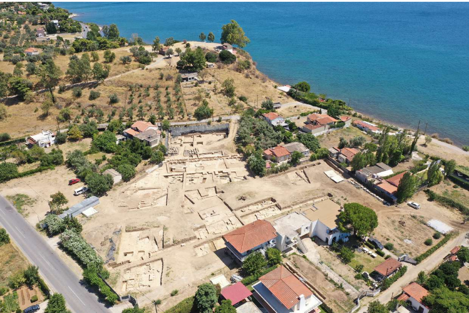
4. Εικόνα από drone του Ιερού της Αμαρυσίας Αρτέμιδος.

αρ. 11), διαστάσεων 5 x 12 μ. Είναι πιθανόν ότι η θεμελίωση αυτή έφερε μνημειώδη βωμό και ότι το κτήριο 6 λειτούργησε ως μικρός ναός. Δυστυχώς, τα αρχαιολογικά στρώματα είναι τόσο διαταραγμένα σε εκείνο το σημείο, ώστε προς το παρόν δεν μπορεί να δοθεί κάποια άλλη ακριβέστερη ερμηνεία. Ένα επιπλέον επιχείρημα, που ενισχύει την ταύτιση με ναό, είναι η ύπαρξη σειράς βάσεων, οι οποίες έφεραν κάποτε αγάλματα ή ψηφίσματα και παρατάσσονταν κατά μήκος των εξωτερικών τοίχων του κτηρίου 6. Από τα αγάλματα αυτά διασώζονται μόνο κάποια μικρά θραύσματα, 5 με εξαίρεση μια φαρέτρα που βρέθηκε κοντά στα θεμέλια του βωμού 11 και η οποία προέρχεται, αναμφίβολα, από χάλκινο αγαλματίδιο της Αρτέμιδος (εικ. 5).