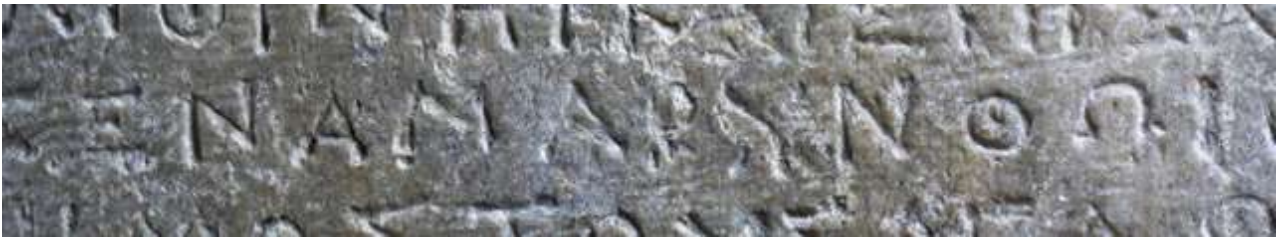
8. Ψήφισμα που αναφέρει το τοπωνύμιο της Αμαρύνθου.

Άμαρυσίαν Άρτεμιν) ή στον δήμο των Κυδαθηναίων, όπου βρισκόταν ιερόν της Αρτέμιδος (τῆς Άθμονόθεν Άμαρυσίας, IG Ι 3 426).