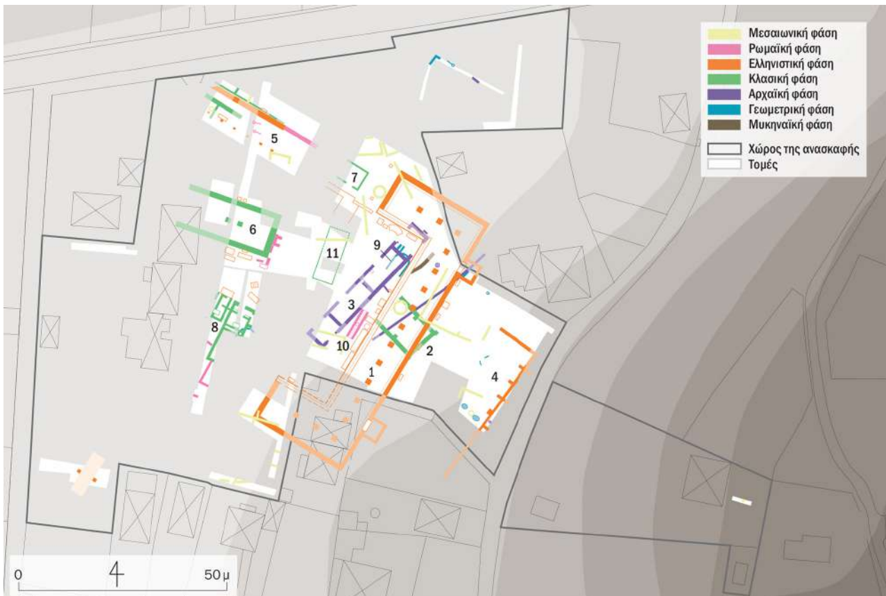
2. Κάτοψη του Ιερού της Αμαρυσίας Αρτέμιδος στην Αμάρυνθο.

Εντός μικρής αρχαιολογικής τομής, που πραγματοποιήθηκε το 2007 στους πρόποδες αυτού του λόφου από την Ελβετική Αρχαιολογική Σχολή στην Ελλάδα (ESAG) σε συνεργασία με την Εφορεία Αρχαιοτήτων Ευβοίας, οι ανασκαφείς εντόπισαν τοιχοποιία Πρωτογεωμετρικών χρόνων (10ος αι. π.Χ.), η οποία καλυπτόταν μερικώς από μεγάλη