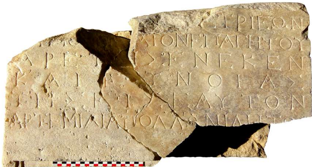
7. Βάση αγάλματος αφιερωμένη στην Αρτέμιδα, τον Απόλλωνα και τη Λητώ.

Το ιερό της Αμαρυσίας Αρτέμιδος βρίσκεται στην επικράτεια της αρχαίας πόλης της Ερέτριας. Ωστόσο, βρισκόταν μακριά για να είναι ένας ταπεινός χώρος τοπικής λατρείας. Διάφορες επιγραφικές και φιλολογικές πηγές (π.χ. Τίτος Λίβιος, Ab Urbecondita XXXV,38· Πausanίας I, 31.5) μαρτυρούν ότι κάτοικοι και άλλων ευβοϊκών πόλεων, κυρίως της Χαλκίδας και της Καρύστου, επισκέπτονταν το ιερό. Το ίδιο το ιερό ήταν χώρος στον οποίον ο δήμος Ερετριέων εξέθετε στο κοινό τα ψηφίσματα και τις συνθήκες με τις άλλες πόλεις του νησιού. Κατά την διάρκεια της εορτής των Αμαρυσίων προς τιμήν της θεάς Αρτέμιδος πραγματοποιούντο αθλητικοί και μουσικοί αγώνες. Τις δαπάνες αναλάμβαναν τοπικοί μαικήνες, όπως στην ύστερη Ελληνιστική εποχή ο Ερετριεύς γυμνασάρχος Ελπίνικος, ο οποίος, σύμφωνα με το ψηφίσμα προς τιμήν του (IG XII, 9, 234), 7 είχε προσφέρει ελαιόλαδο όχι μόνο για τους πολίτες, αλλά και όλους τους άλλους, δηλαδή τους ξένους που προσέρχονταν και συμμετείχαν στις πανηγύρεις. Η λατρεία προς τιμήν της Αμαρυσίας Αρτέμιδος ήταν τόσο σημαντική, ώστε εξήχθη στην Αττική, όπου σύμφωνα με τον Pausanias (I, 31, 4-5), υφίστατο στον δήμο των Αθμονέων 8 ( Αθμονεῖς δ' ἐτίμῳσιν