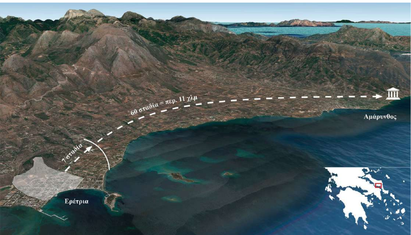
1. Χάρτης (από Google earth) με την απόσταση του Ιερού της Αρτέμιδος από την Ερέτρια. Ο χάρτης σχεδιάστηκε από την ESAG/ΕΑΣΑ.

Η ύπαρξη του ιερού της Αμαρυσίας Αρτέμιδος στην Αμάρυνθο Ευβοίας ήταν γνωστή μόνο από τις γραπτές πηγές. Κατ' αρχήν, πρέπει να αναφέρουμε τον γεωγράφο Στράβωνα, ο οποίος συνέγραψε τον 1ο αι. π.Χ. το μεγάλο έργο του για τη γεωγραφία του αρχαίου κόσμου. Στο πρώτο κεφαλαίο του 10ου βιβλίου, αφιερωμένου στη γεωγραφία της Ευβοίας, μνημονεύει πολλές φορές το εν λόγω ιερό. Σε μία παράγραφο (X, 1, 12), αναφέρει μία συμφωνία, η οποία καθορίζει τις συνθήκες μάχης μεταξύ των πόλεων της Ερέτριας και της Χαλκίδας. Αυτή η συμφωνία, με την οποία οι δυο πόλεις αποδέχονται να μην χρησιμοποιούν τηλεβόλα όπλα, ήταν γραμμένη σε μια στήλη που είχε ανεγερθεί στο ιερό της Αμαρύνθου ( έν τῷ Ἀμαρυνθίῳ στήλῃ ).