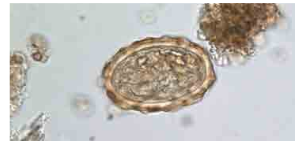
Œuf d' Ascaris lumbricoides - 66,5 x 53 µm; indiv. 1018 (M. Le Bailly)

Les conditions de vie précaires, le manque d'hygiène corporelle, les difficultés à gérer les déchets organiques et la présence avérée de nuisibles faisaient parti du quotidien des soldats du Kilianstollen , et ont favorisé le développement de pathologies parasitaires.