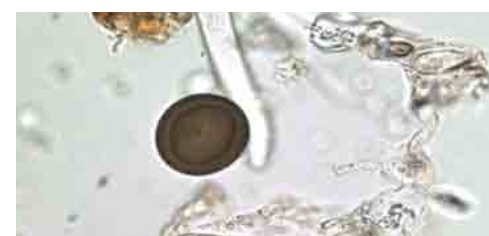
Œuf de Taenia sp. - 35 x 32 µm; indiv. 1018 (M. Le Bailly)