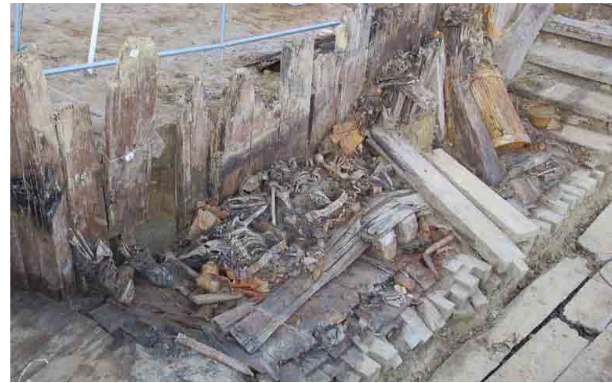
Détail d'un escalier avec la présence des individus 1016, 1017, 1018, 1019, 1020 et 1021 (PAIR)