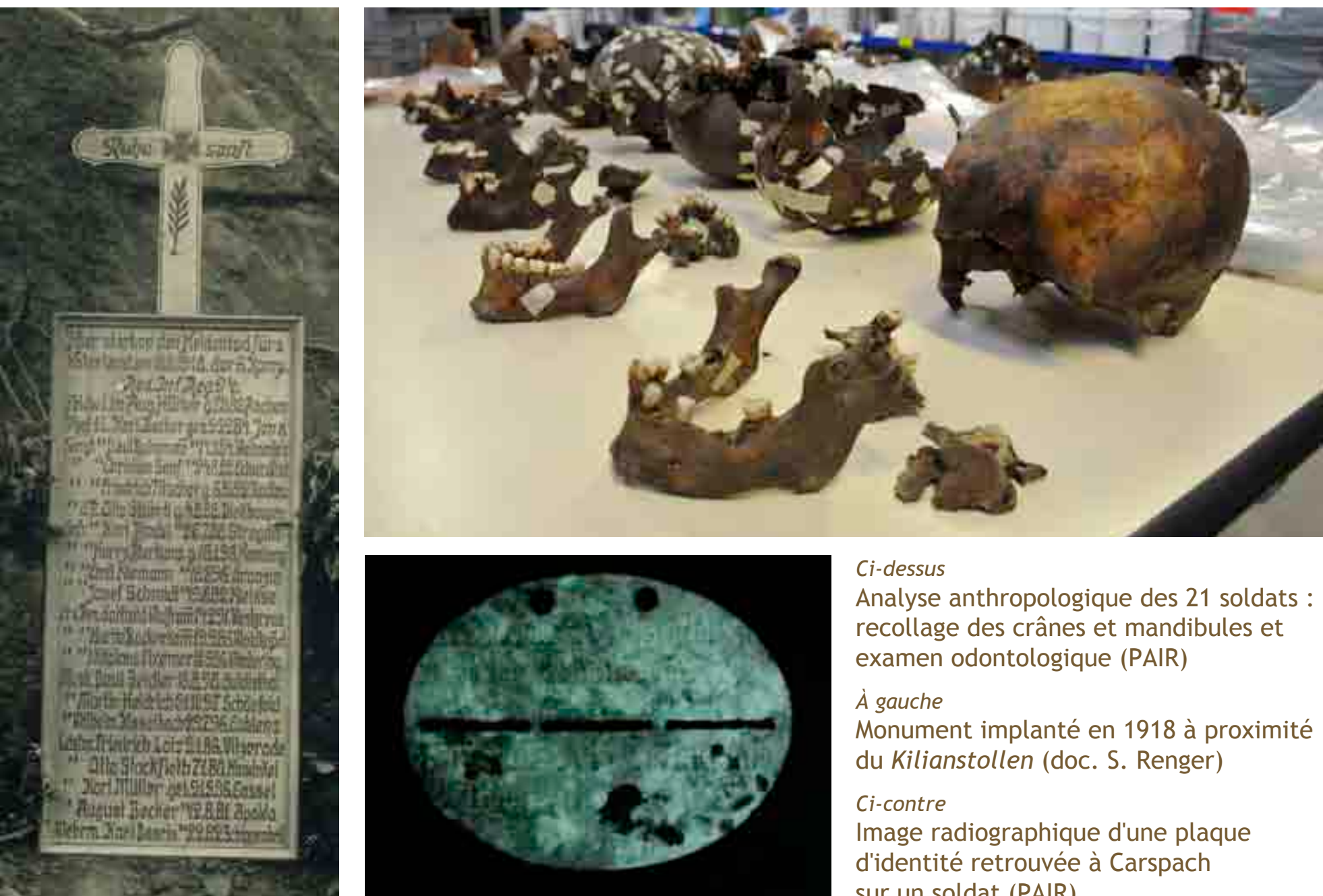
Ci-dessus Analyse anthropologique des 21 soldats : recollage des crânes et mandibules et examen odontologique (PAIR) À gauche Monument implanté en 1918 à proximité du Kilianstollen (doc. S. Renger) Ci-contre Image radiographique d'une plaque d'identité retrouvée à Carspach sur un soldat (PAIR)

Aujourd'hui, 18 individus ont pu être identifiés parmi l'échantillon et portent désormais un nom.