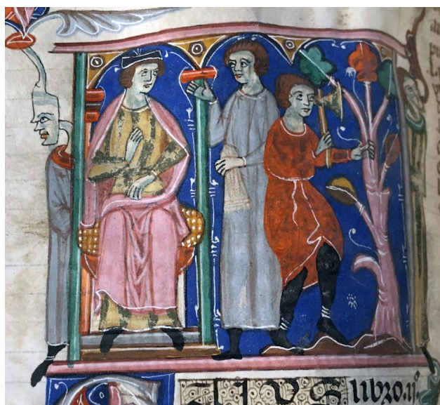
Fig. 3 - L'autorità riceve una prestazione in denaro in cambio del permesso di far legna Paris, BnF, Ms. Lat. 4484, f° 50v

riceve una prestazione in denaro, come si evince dalla borsa, scarsella, che tiene in mano il personaggio posto al centro dell'immagine. Essa testimonia di come la fauna selvatica fosse assimilata alle risorse naturali, ai fructus , assimilazione espressa nella glossa ingrediatur di Accursio, su cui ci siamo soffermati precedentemente 42 . L'illustrazione quindi sembra svolgere un ruolo di collegamento fra testo e glossa offrendone una sintesi.