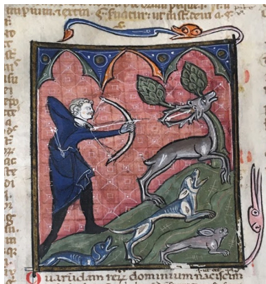
Fig. 13 - Caccia al cervo e alla lepre con l'arco, con un cane da seguita e un levriero Paris, BnF, Ms. Lat. 4483, f° 18v