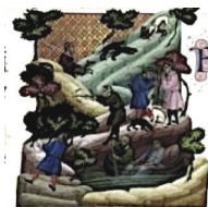
Fig. 9 - Maestro del 1328 e bottega. Pesca « a navicella » con la rete, caccia alla lepre con i cani, caccia agli uccelli con il balestro Paris, BnF, Ms. Lat. 14341, f° 60v

L'acquisizione del dominio tramite occupazione. Il rapporto testo-immagine nelle illustrazioni del libro 41, tit. 1 del Digesto e del libro 2, tit. 1 delle Istituzioni di Giustiniano nei manoscritti della BnF (XIII-XIV secolo)