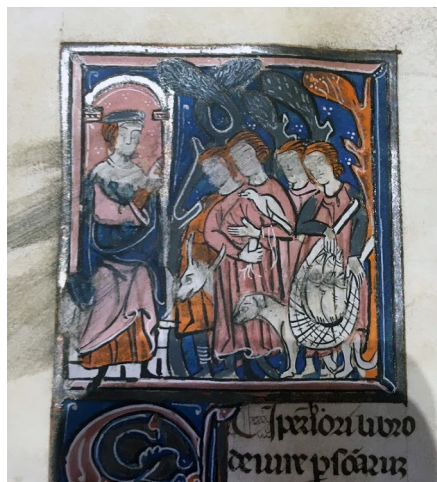
Fig. 2 - Un gruppo di cacciatori e un pescatore di fronte all'autorità sovrana Paris, BnF, Ms. Lat. 4428, f° 13v

L'acquisizione del dominio tramite occupazione. Il rapporto testo-immagine nelle illustrazioni del libro 41, tit. 1 del Digesto e del libro 2, tit. 1 delle Istituzioni di Giustiniano nei manoscritti della BnF (XIII-XIV secolo)