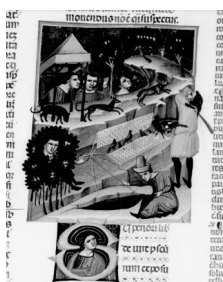
Fig. 5 - Illustratore, Maestro del Graziano di Parigi. Pesca alla canna, cattura degli uccelli col bertovello , caccia alla lepre con cani da seguita e levrieri Paris, BnF, Ms. Lat. 14343, f° 15, la miniatura è in bianco e nero per esigenze di conservazione del manoscritto

Il secondo gruppo di manoscritti di cui analizzeremo le miniature e che illustrano il libro 41, tit. 1 del Digesto e il libro 2, tit. 1 delle Istituzioni sono i manoscritti latin 4478, 4440, 4438, 14341 e 14343, prodotti durante il XIV secolo e illustrati a Bologna. La storica dell'arte Susanne l'Engle ne ha studiato l'iconografia, identificando anche i probabili autori delle miniature. L'autrice sottolinea che nel corso del XIV secolo l'iconografia di queste immagini divenne più complessa fino a rappresentare dettagliatamente tutti i modi nei quali le attività di caccia e di pesca si realizzavano. Talvolta la resa grafica è particolarmente originale come nel manoscritto 14343, delle Istituzioni di Giustiniano, opera del maestro Graziano, dove le attività di caccia e pesca sono distribuite su quattro livelli prospettici (fig. 5)