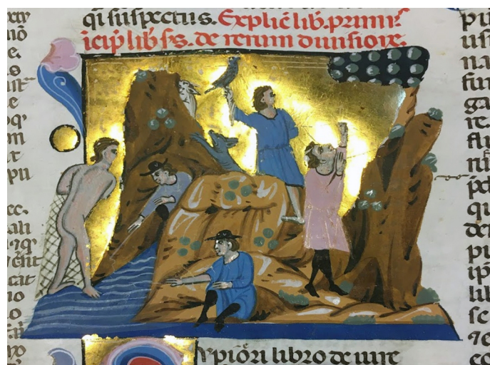
Fig. 7 - Bottega di Gregorio-Graziano di Parigi. Caccia agli uccelli con il balestro, caccia alla lepore con un braccio da sangue, pesca con rete da pesca: negossa o giacchio Paris, BnF, Ms. Lat. 4438, f° 18v

I manoscritti latin 4438 e latin 4440 57 rappresentano la caccia col balestro (fig. 7 e 8). Il cap. XXVIII del trattato descrive « come gli uccelli si prendano con balestro, e con arco, dovunque sieno, o in terra, o in arbore », dando istruzioni molto precise sulla forma delle saette. Se il balestratore vuole cacciare oche o grandi uccelli la saetta deve essere biforcata; se invece si vogliono cacciare « in arbore piccioni, colombi o pippioni », i materezzoli devono essere « di pari peso » e in ogni caso il balestratore deve tenere, quando si accinge a colpire la preda, la mano fermissima. Gli uccelli anche con questa tecnica per poter essere colpiti dovevano essere messi in fuga o attirati. Vari metodi sono a riguardo indicati, come quello di utilizzare una civetta o un gufo, le testa di una gatta, « imperoché gli uccelli a quel vengono ». Nel campo o nella via l'uccellatore può portare « sopra se lieve strumento di molte frondi con le quali si possa nascondere »; gli uccelli in questo caso si possono « commuovere » con il solo suono delle frondi, e « chiamargli si possono con qualunque strane e inusitate voci s'allettano imperocché si meravigliano di quelle » 58 .