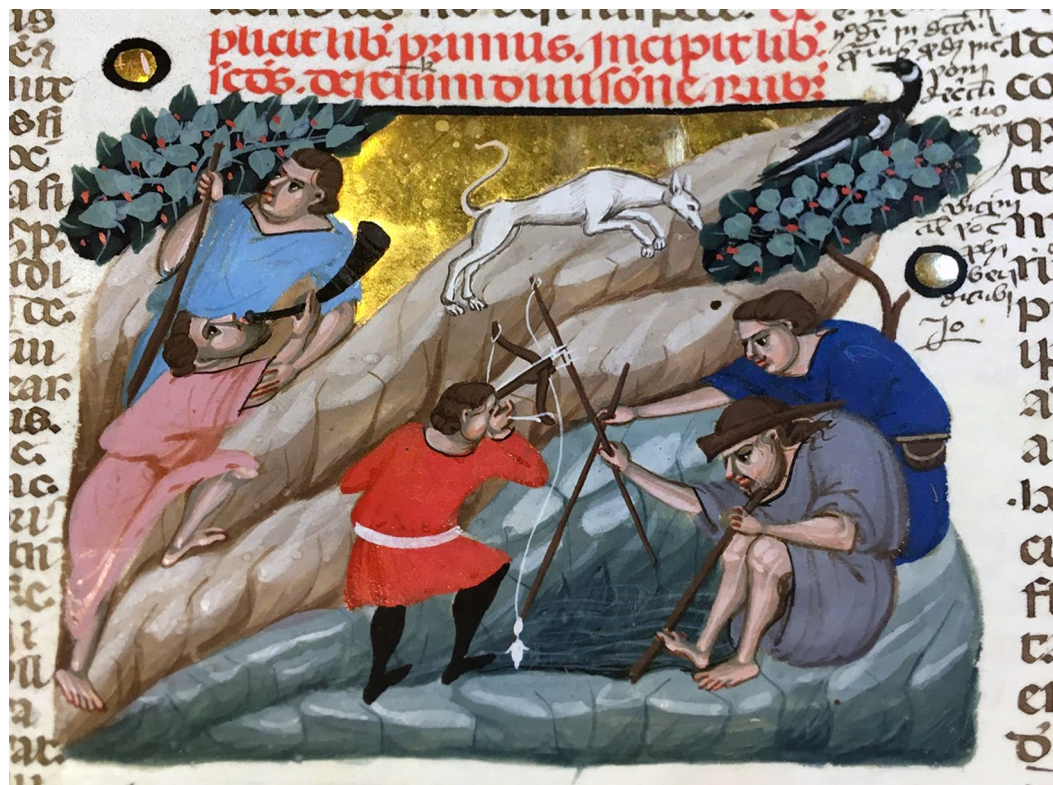
Fig. 8 - Maestro del Graziano di Napoli. Caccia agli uccelli con con il balestro, il corno da caccia e un levriero bianco e pesca all'amo Paris, BnF, Ms. Lat. 4440, f° 15v

L'acquisizione del dominio tramite occupazione. Il rapporto testo-immagine nelle illustrazioni del libro 41, tit. 1 del Digesto e del libro 2, tit. 1 delle Istituzioni di Giustiniano nei manoscritti della BnF (XIII-XIV secolo)