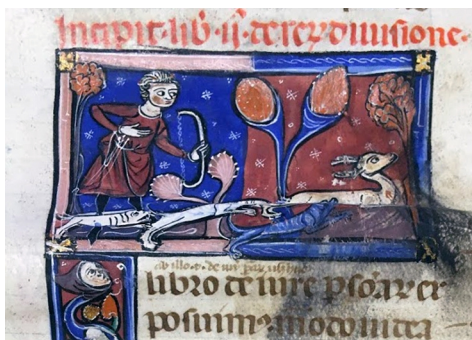
Fig. 10 - Caccia al cervo con l'arco e con i cani: bracco da sangue, un levriero e un cane da seguita.

Passiamo ora all'analisi del nostro corpus di manoscritti illustrati nella Francia del Midi . Vediamo per esempio rappresentata nel manoscritto 4432 82 una caccia al cervo (fig. 10). Un cervo ferito da un cacciatore arciere fugge nella foresta inseguito da tre cani di razze differenti : un bracco da sangue, un levriero e un cane da seguita. La stessa rappresentazione di caccia in foresta, ancora più stilizzata, la troviamo raffigurata nel manoscritto latin 4423 83 dove un cervo in fuga, già colpito da una freccia conficcata nel suo collo, é attaccato di slancio probabilmente da un levriero (fig. 11).