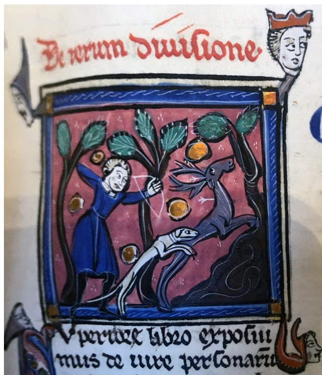
Fig. 11 - Caccia al cervo con l'arco e con un levriero Paris, BnF, Ms. Lat. 4423, f° 20

L'acquisizione del dominio tramite occupazione. Il rapporto testo-immagine nelle illustrazioni del libro 41, tit. 1 del Digesto e del libro 2, tit. 1 delle Istituzioni di Giustiniano nei manoscritti della BnF (XIII-XIV secolo)