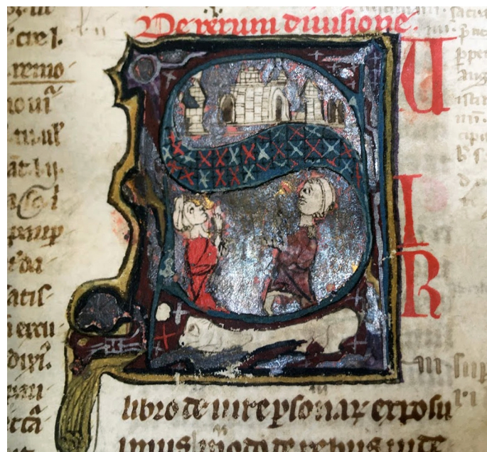
Fig. 4 - Due cacciatori di fronte una città Paris, BnF, Ms. Lat. 8936, f° 15

L'acquisizione del dominio tramite occupazione. Il rapporto testo-immagine nelle illustrazioni del libro 41, tit. 1 del Digesto e del libro 2, tit. 1 delle Istituzioni di Giustiniano nei manoscritti della BnF (XIII-XIV secolo)