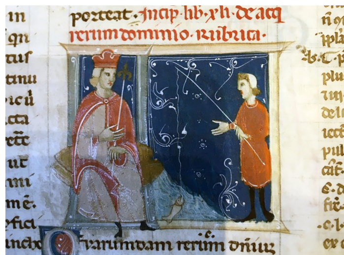
Fig. 1 - Un pescatore sembra presentare all'imperatore i risultati della sua pesca Paris, BnF, Ms. Lat. 4480, f° 64

L'acquisizione del dominio tramite occupazione. Il rapporto testo-immagine nelle illustrazioni del libro 41, tit. 1 del Digesto e del libro 2, tit. 1 delle Istituzioni di Giustiniano nei manoscritti della BnF (XIII-XIV secolo)