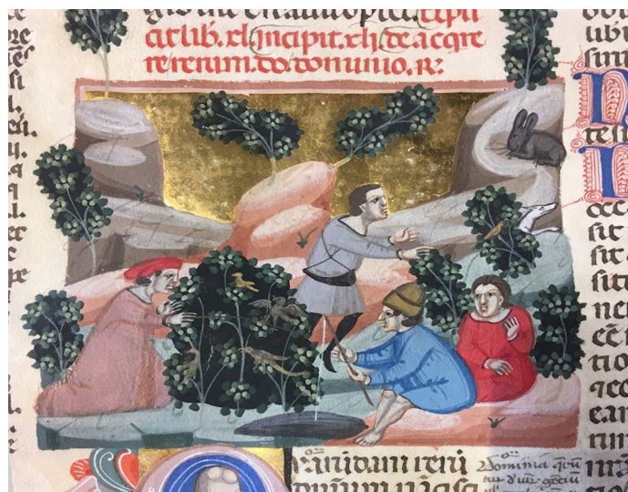
Fig. 6 - Maestro B 18 e bottega. Aucupium vagante al vischio, caccia alla lepre con un levriero bianco, pesca con la canna Paris, BnF, Ms. Lat. 4478, f° 59v

Nella miniatura presente nel manoscritto 4478 53 é raffigurata l' aucupium vagante al vischio, o pania, come si evince dai vari cespugli di vischio raffigurati nella miniatura (fig. 6).