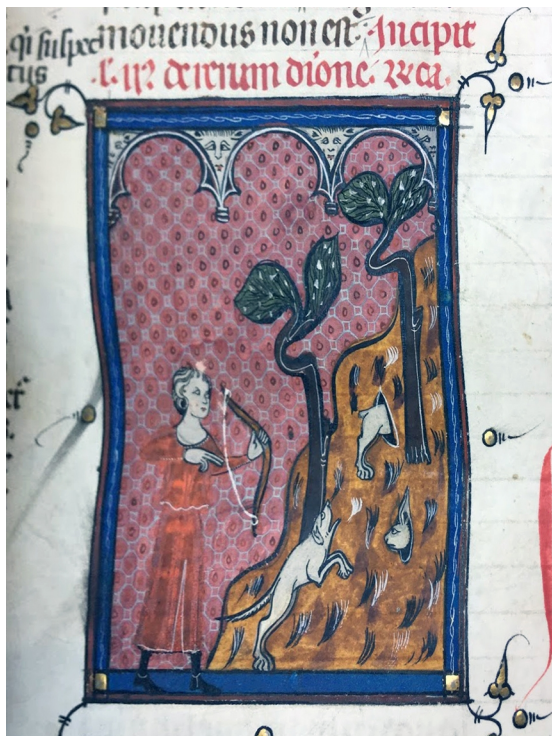
Fig. 12 - Caccia alla lepre nelle tane della garenne con l'arco e un cane da seguita Paris, BnF, Ms. Lat. 16905, f° 13

L'acquisizione del dominio tramite occupazione. Il rapporto testo-immagine nelle illustrazioni del libro 41, tit. 1 del Digesto e del libro 2, tit. 1 delle Istituzioni di Giustiniano nei manoscritti della BnF (XIII-XIV secolo)