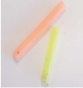
Figure 3 : Paille corail et paille jaune retrouvées au domicile du patient