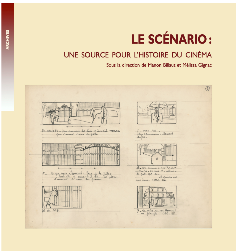
Figure 1. M. Billaut, M. Gignac (dir.), Le scénario : une source pour l'histoire du cinéma , Paris, AFRHC, 2020.